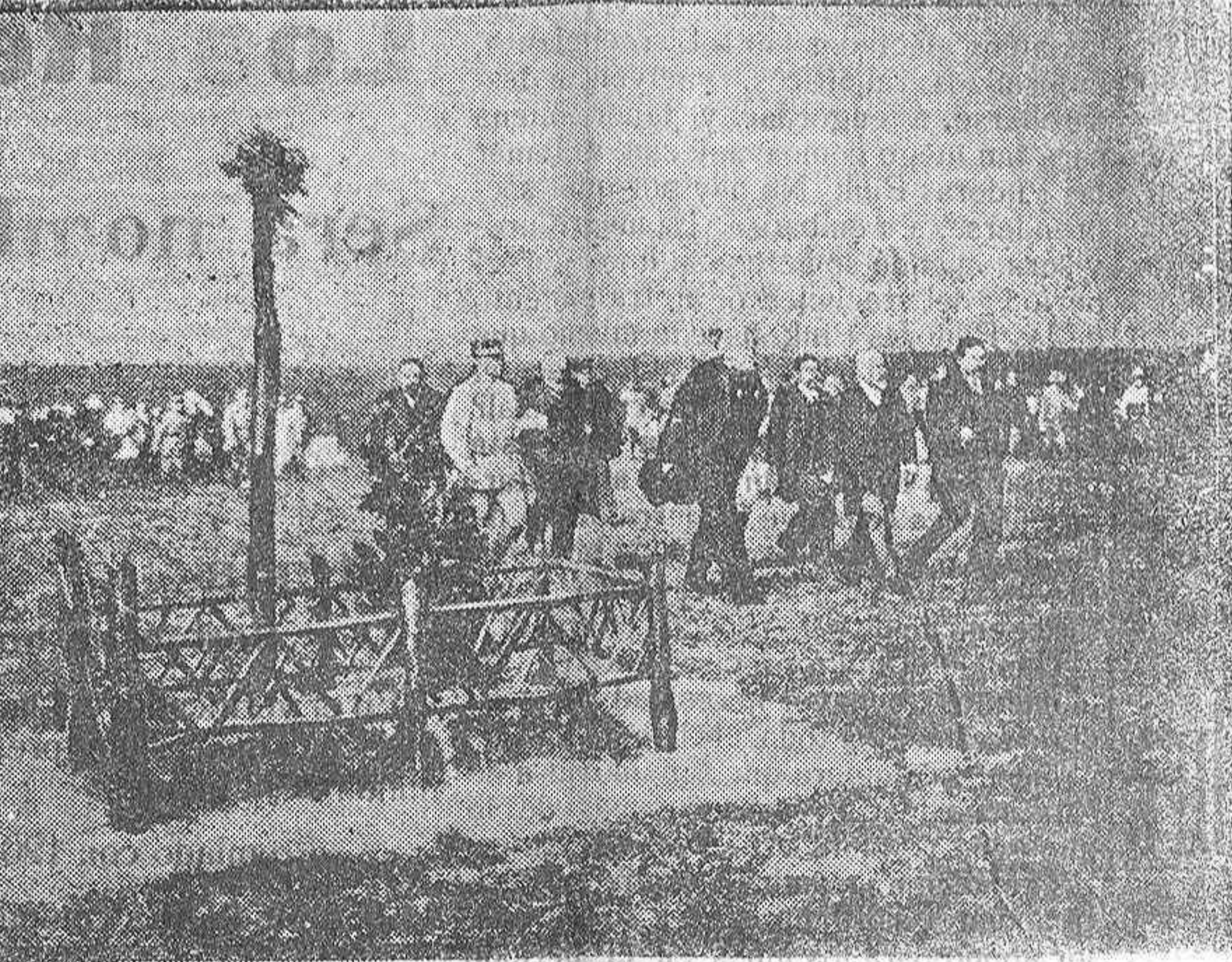
Tercer aniversario de la Victoria del Marne Los señores Polcaré, Ribot, Painlevé, Steeg y el general Petain, saludando las tumbas de los soldados muertos en aquella batalla.