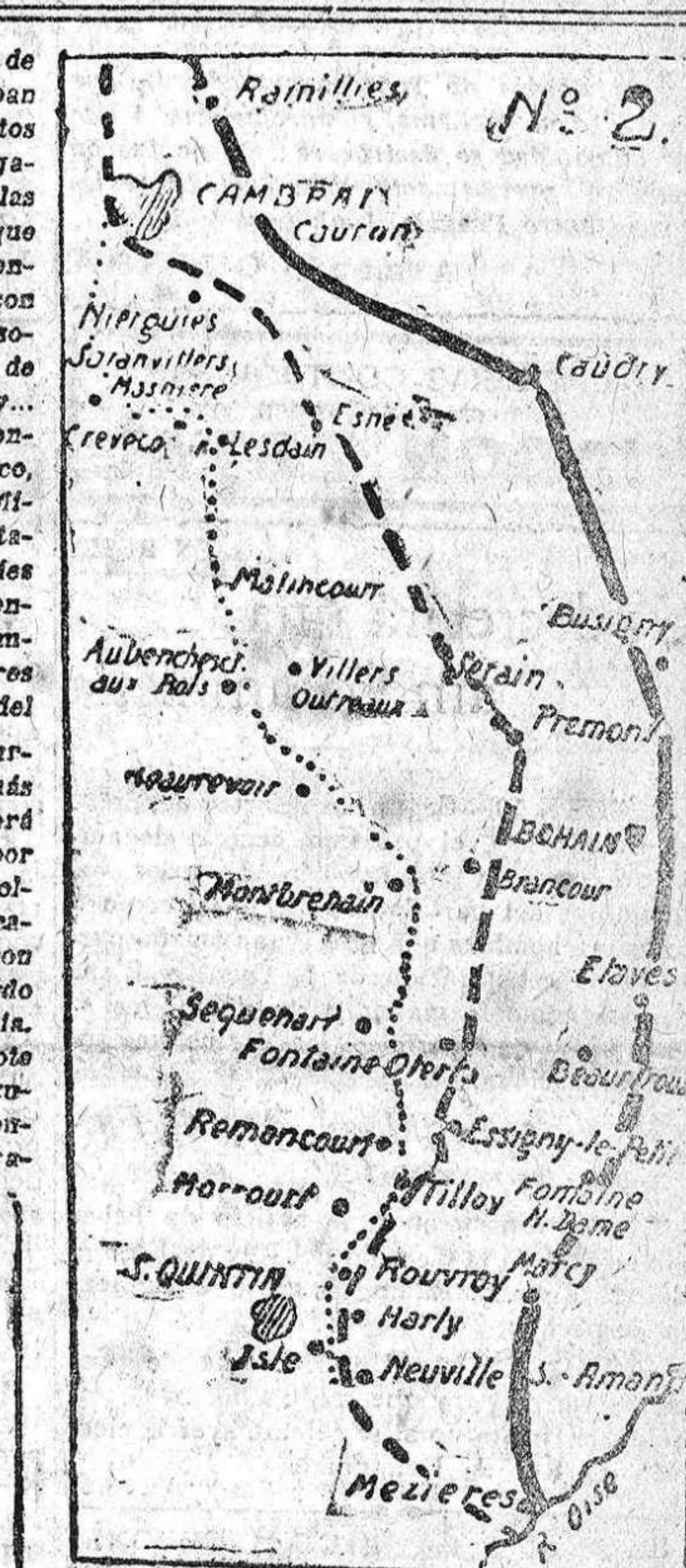
Escala 0 5 10 15 Kilómetros

¿Fue por falta de primeras materias, ó de brazos, por lo que los alemanes que estaban en el frente han carecido de los elementos que necesitaban?... Puede responderse negativamente... Lo que ocurrió fué que las ideas salvan las fronteras rápidamente; que los socialistas alemanes, que antes se sentían alemanes sobre todo, contaminados con los rusos, se acordaron sólo de que eran socialistas... Las ideas pararon las ruedas de las fábricas áminoraron su marcha, y... sucedió lo que tenía que suceder. Así se concibe también este salto brusco, gigantesco, que ha dado el Imperio alemán en su política interior, constituyendo hoy un Estado tan democrático que los bolcheviques (restupendo caso) entienden que se encuentran en el deber de ayudar á los Imperios centrales con hombres y víveres (hace días oímos que con su escuadra del mar Negro), «contra el imperialismo burgués francoinglés que está en auge, más fuerte y más peligroso que nunca». ¿Será cierta la noticia?... Verosímil es... Diferir por qué. Pruebas palpables han dado los bolcheviques á los aliados en repetidas ocasiones de que no los quieren bien. Wilson hace días recababa el concurso del mundo entero para hacer entrar en razón á Rusia. El altruismo dictaba este gesto al Gullito de este siglo? Quizá; pero bien pudiera suceder que los tenedores de Deuda rusa contribuyeran á ello... Si los Imperios cen-