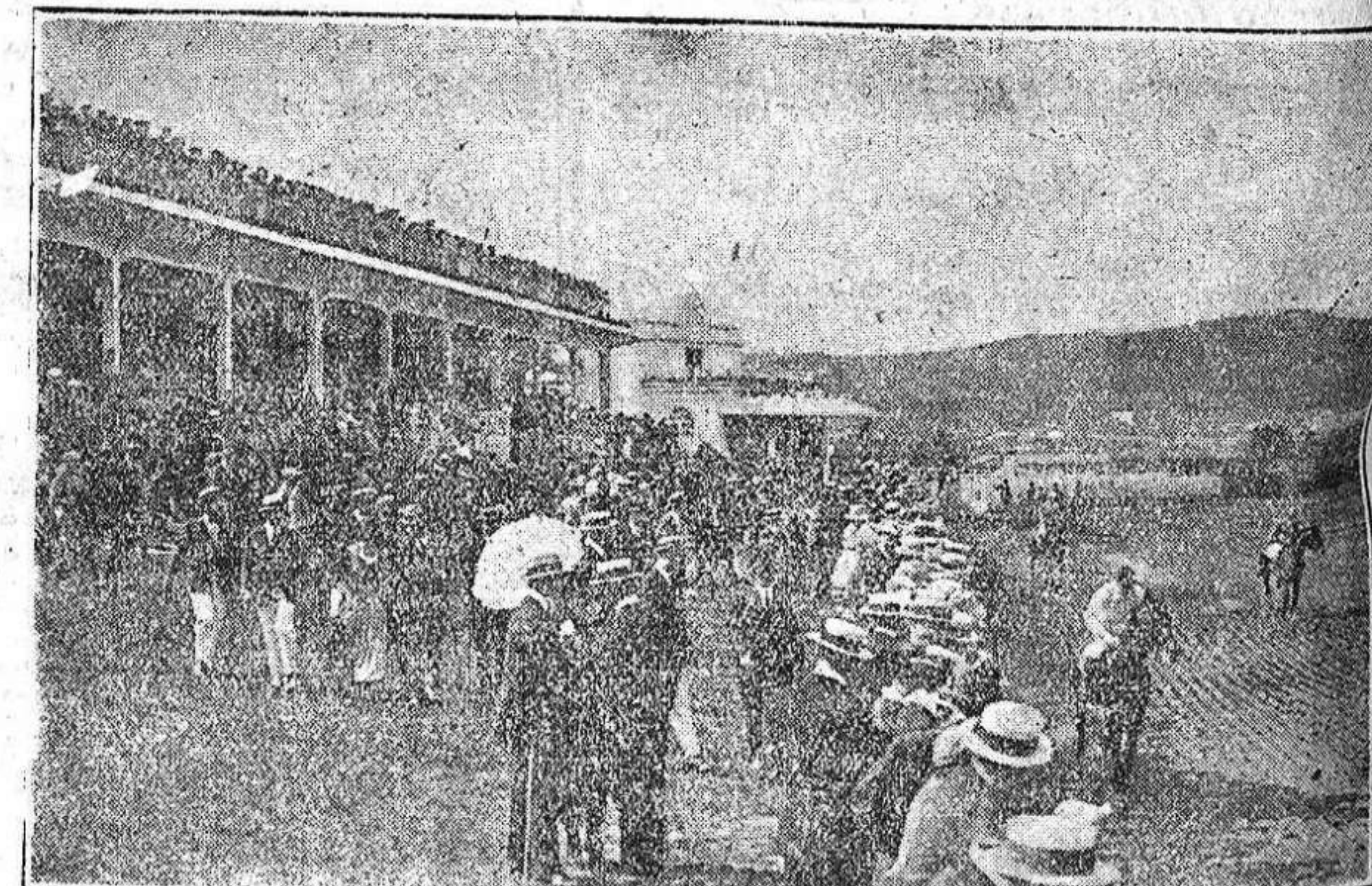
Aspecto del Hipódromo de Lasarte el día de la Inauguración de la temporada