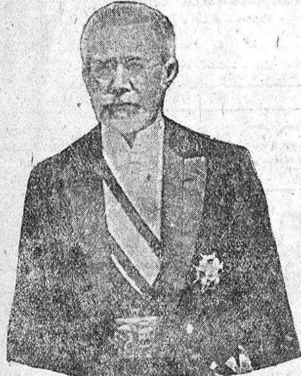
D. Mariano Zuaznavar. Alcalde de San Sebastián

En el pintoresco pueblo de Pasajes, a veinte minutos de San Sebastián, y en la orilla misma del Cantábrico, dividiéndose un bellísimo panorama, hállase situado este magnífico restaurant, tan popular y tan justamente acreditado. Dispone de una gran terraza al aire libre, sobre el mar, sitio encantador que visitan todos los forasteros. Cuenta con un gran vivero de ostras, langostinas y toda clase de mariscos, y sirve almuerzos, comidas y banquetes con gran esmero y economía. Recomendamos a todos los visitantes que no dejen de visitar este establecimiento, donde pasarán un rato delicioso.