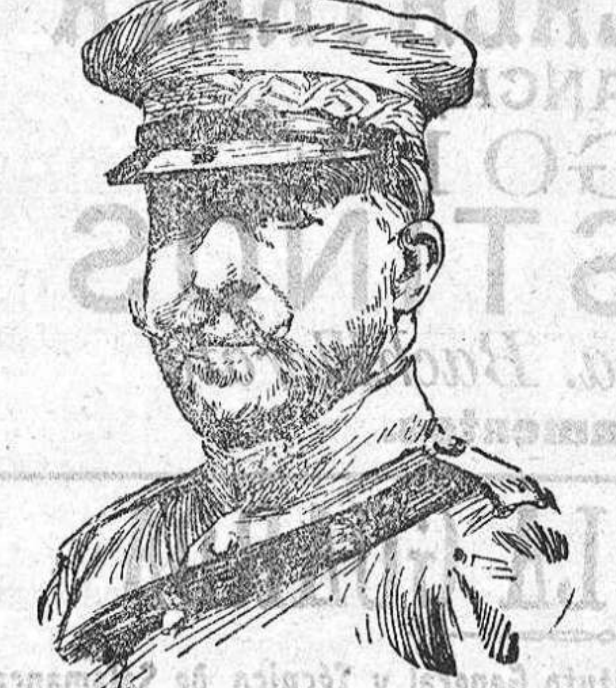
General Aguilera, destinado a mandar las fuerzas de Tetuán-Laucién.