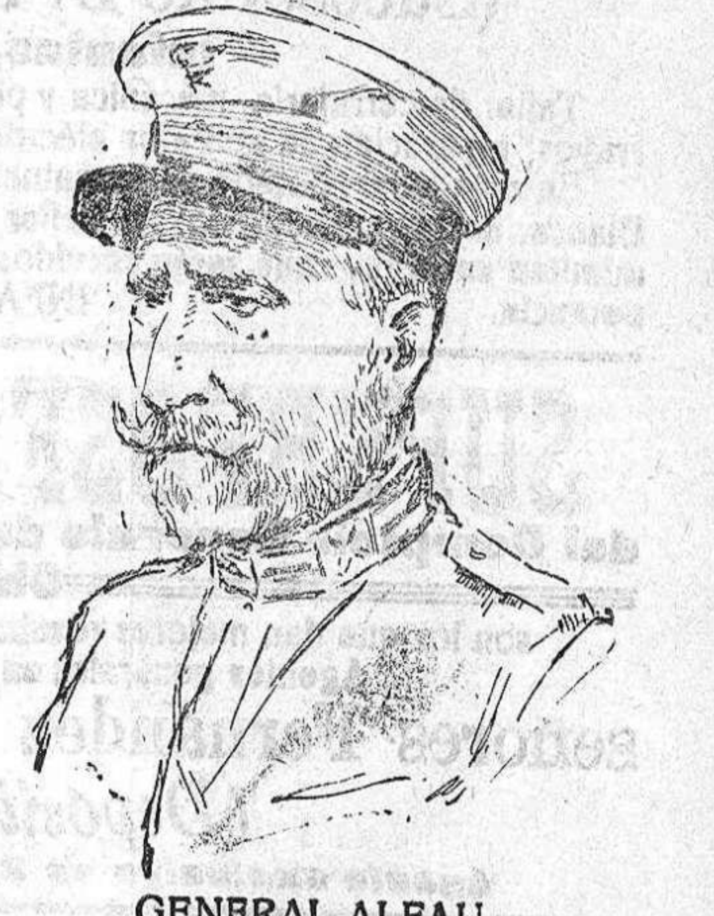
GENERAL ALFAU tal cosa afirman, aunque a hechos de tal naturaleza y a otros muchos más graves y dañinos para los intereses patrios, nos tienen acostumbrados las intrigas y las ambiciones que parecen obligados parásitos de los centros del poder y de la política.

No por muy anunciado y no menos esperado, ha dejado de producir honda sensación el relevo, esta es la palabra, aunque sea doloroso decirlo, del general Alfau, del cargo de alto comisario de España en Marruecos. Los amigos del general Alfau, y no pocos de los que saben muy bien lo que pasa entre los batidores políticos, presentan a la simpática figura de aquel, como una víctima de la política imperante. Ojalá estén equivocados los que