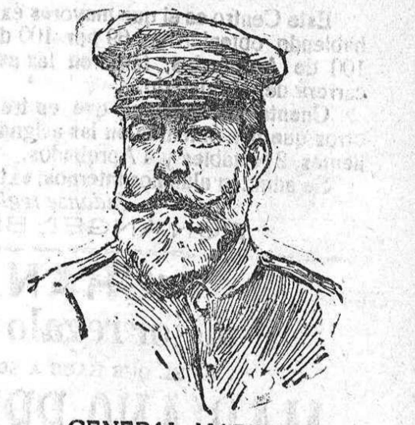
GENERAL MARINA Pero sea o no verdad cuanto se dice acerca de la sustitución del general Alfau por el general Marina, en la Comisaría de España en Marruecos, no puede darse al olvido que el primero ocupó Tetuán sin disparar un tiro, y que precisamente cuando surgió la guerra en los alrededores de aquella plaza, comenzó a hablarse de discrepancias y de disgustos.