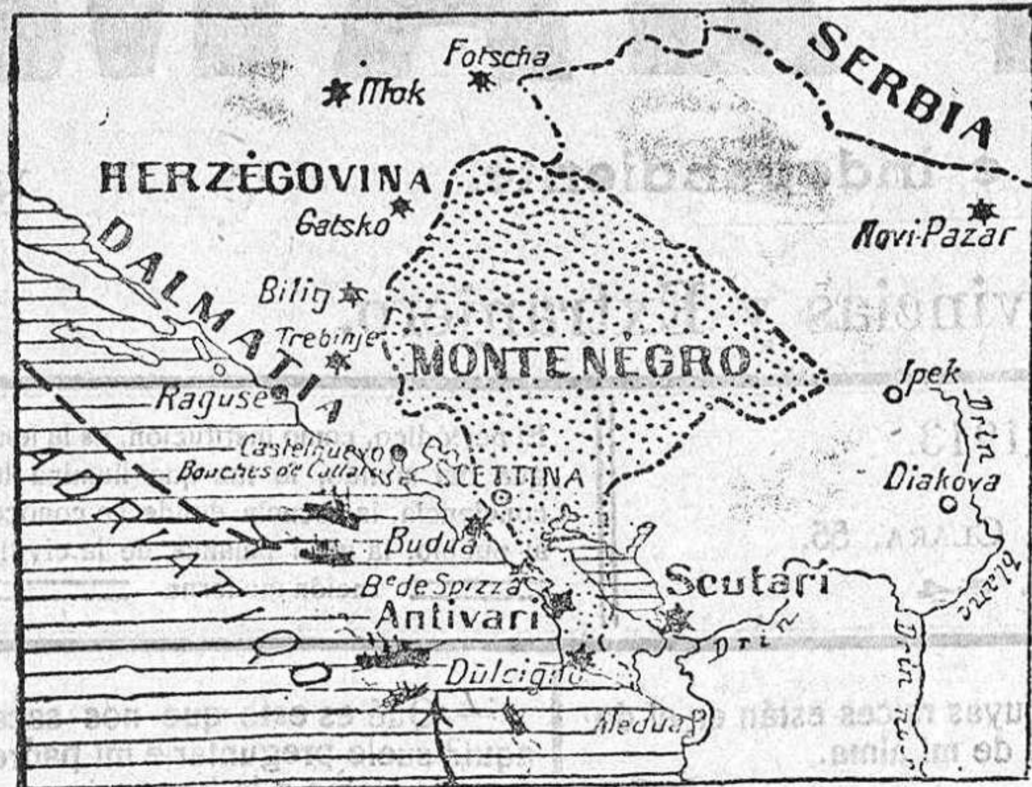
Mapa de las costas bloqueadas por la escuadra internacional.