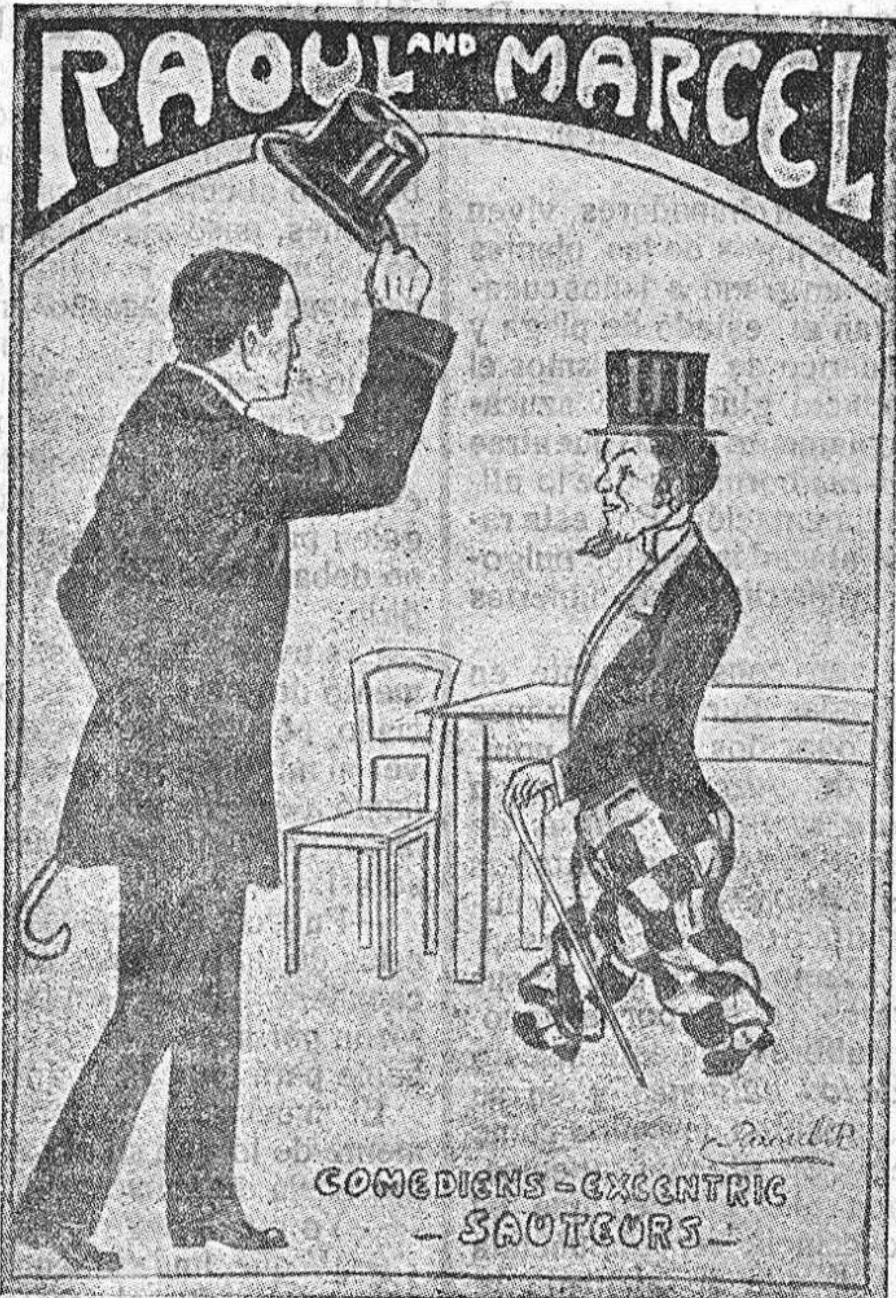
que actúan en el cine de Buenaventura.