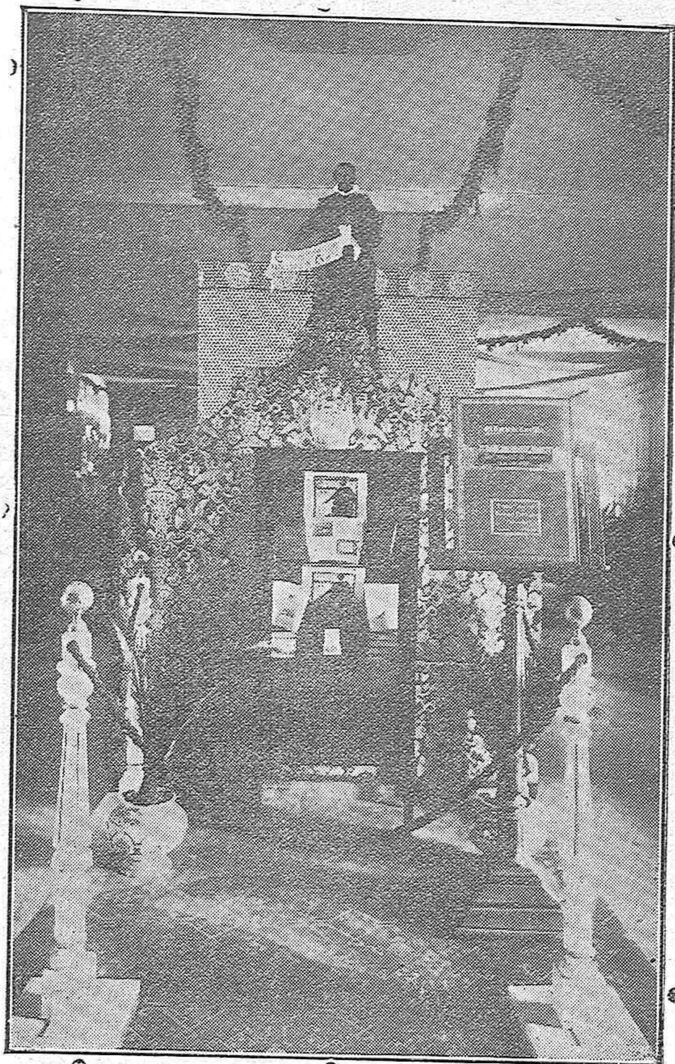
Española instalación de nuestro colega "El Norte de Castilla", que está llamando poderosamente la atención de los concurrentes a la Asamblea Cerealista.

tural para el cultivo cerealista y que en esta época dictatorial se advierte un optimismo productor.