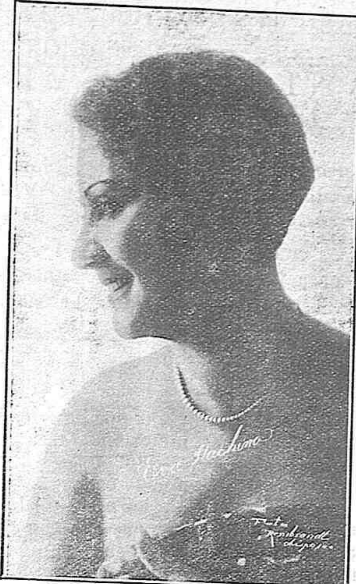
La gran Eva Stachino que debutará el jueves 29, en el Teatro Principal.