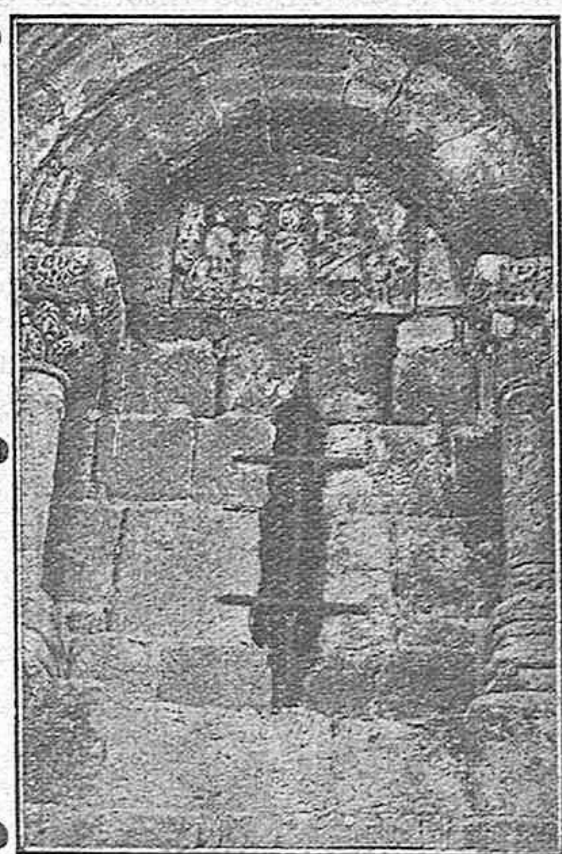
Ventana del ábside de la iglesia de San Cipriano.

En el círculo interior campea el Crismón o monograma cristiano X P S, y a uno y otro lado en la parte superior, las dos letras griegas "alfa" y "omega", principio y fin, símbolo de la divinidad de Cristo y protesta antiortodoxa. En la parte inferior, hacia la derecha, hay otra representación enigmática, que podrá ser el pelicano,