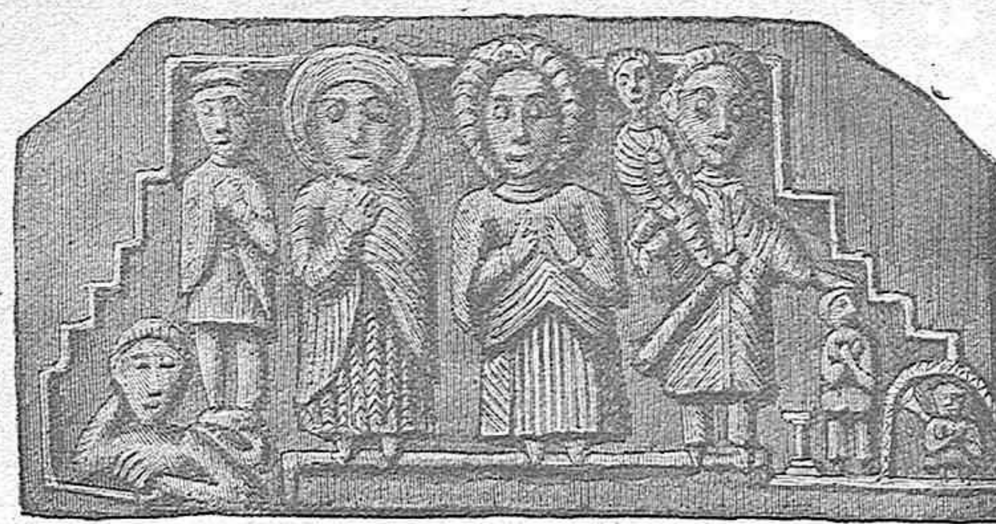
San Cebrián.—Tímpano de la ventana absidal (Evangelio).