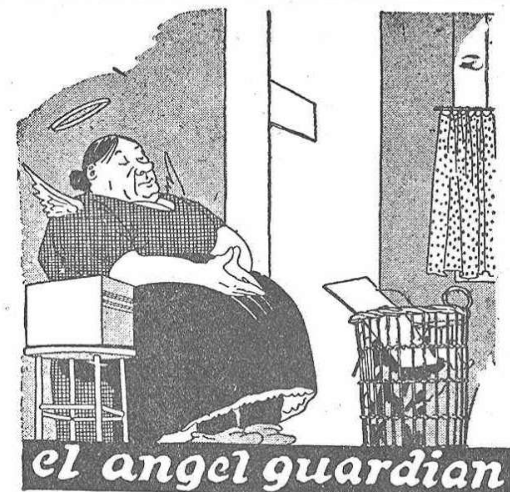
el angel guardian