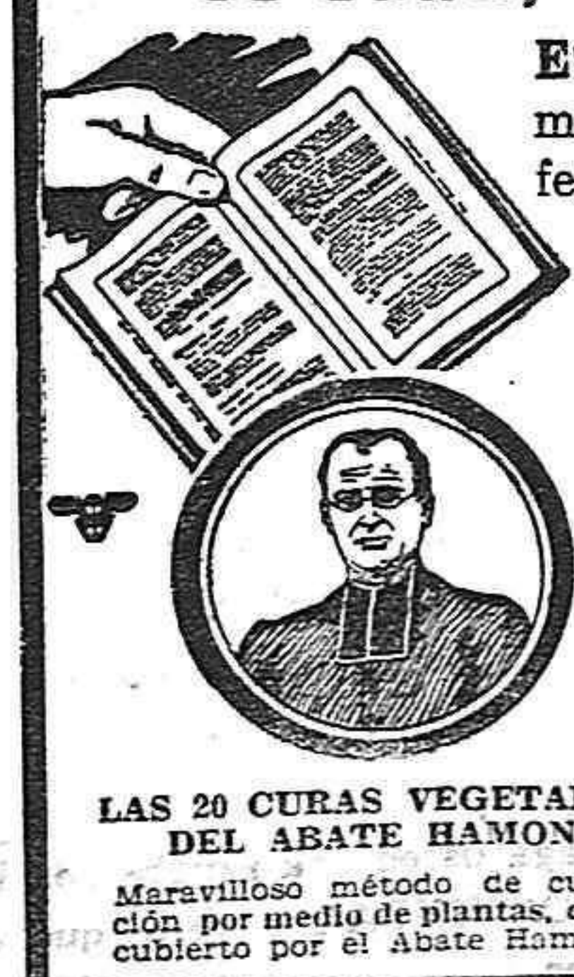
Las 20 curas vegetales del Abate Hamon. Maravilloso método de curación por medio de plantas, descuberto por el Abate Hamon.