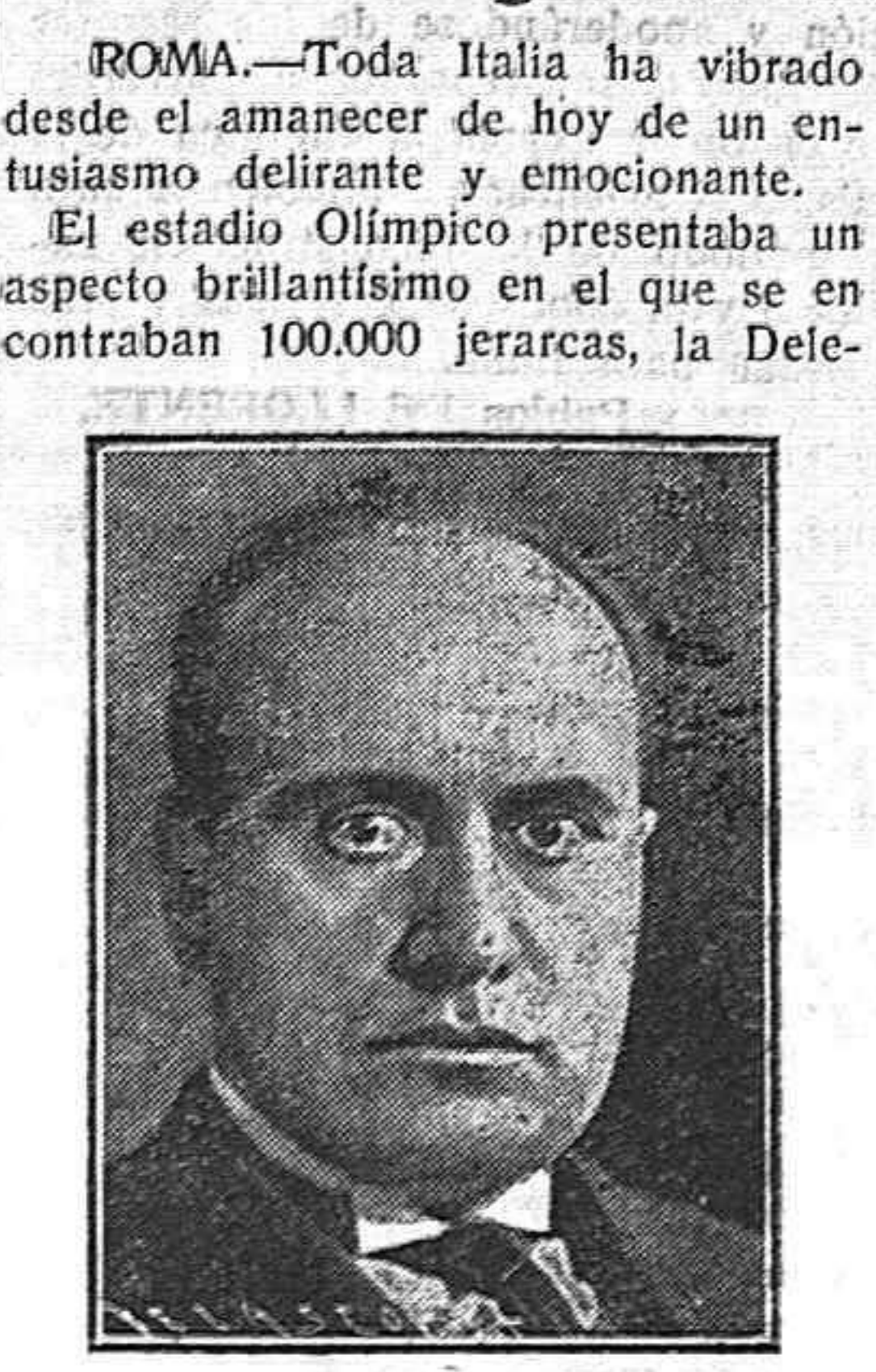
He aquí al creador y conductor de los fascios que salvaron a Italia del comunismo.

ROMA.—Toda Italia ha vibrado desde el amanecer de hoy de un entusiasmo delirante y emocionante. El estadio Olímpico presentaba un aspecto brillantísimo en el que se encontraban 100.000 jercas, la Dele-