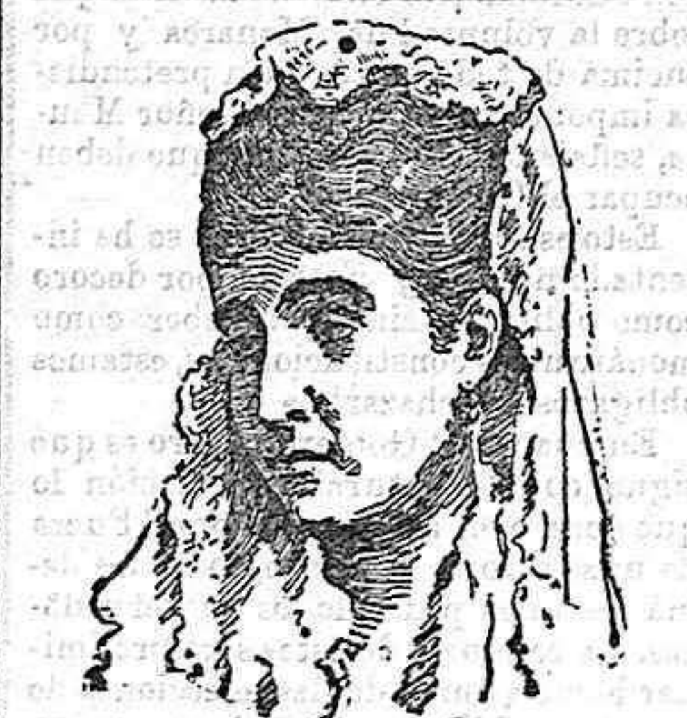
Adelina Patti, que celebra sus bodas de oro con el arte.

Primer contacto con la sombra, 3 horas, 46 minutos y 4 segundos. Principio del eclipse total, 5 horas, nueve minutos. Medio del eclipse, 5 horas, 34 minutos y 4 segundos. Fin del eclipse total, 5 horas, 59 minutos y 7 segundos. Último contacto con la sombra, 7 horas, 22 minutos y 3 segundos. Último contacto con la penumbra, 8 horas, 34 minutos y 8 segundos. Noviembre 1-2.—Eclipse parcial de Sol invisible en España. Valor de la máxima fase aparente: 0.85. Noviembre 16-17.—Eclipse total de Luna visible en España. Horas de las fases: Primer contacto con la penumbra, 21 horas, 46 minutos y 6 segundos. Primer contacto con la sombra, 22 horas, 44 minutos. Principio del eclipse total, 23 horas, 54 minutos y 9 segundos. Medio del eclipse, 20 minutos y 8 segundos. Fin del eclipse total, 46 minutos y 8 segundos. Último contacto con la sombra, una hora, 57 minutos y 6 segundos. Último contacto con la penumbra, 2 horas, 55 minutos.