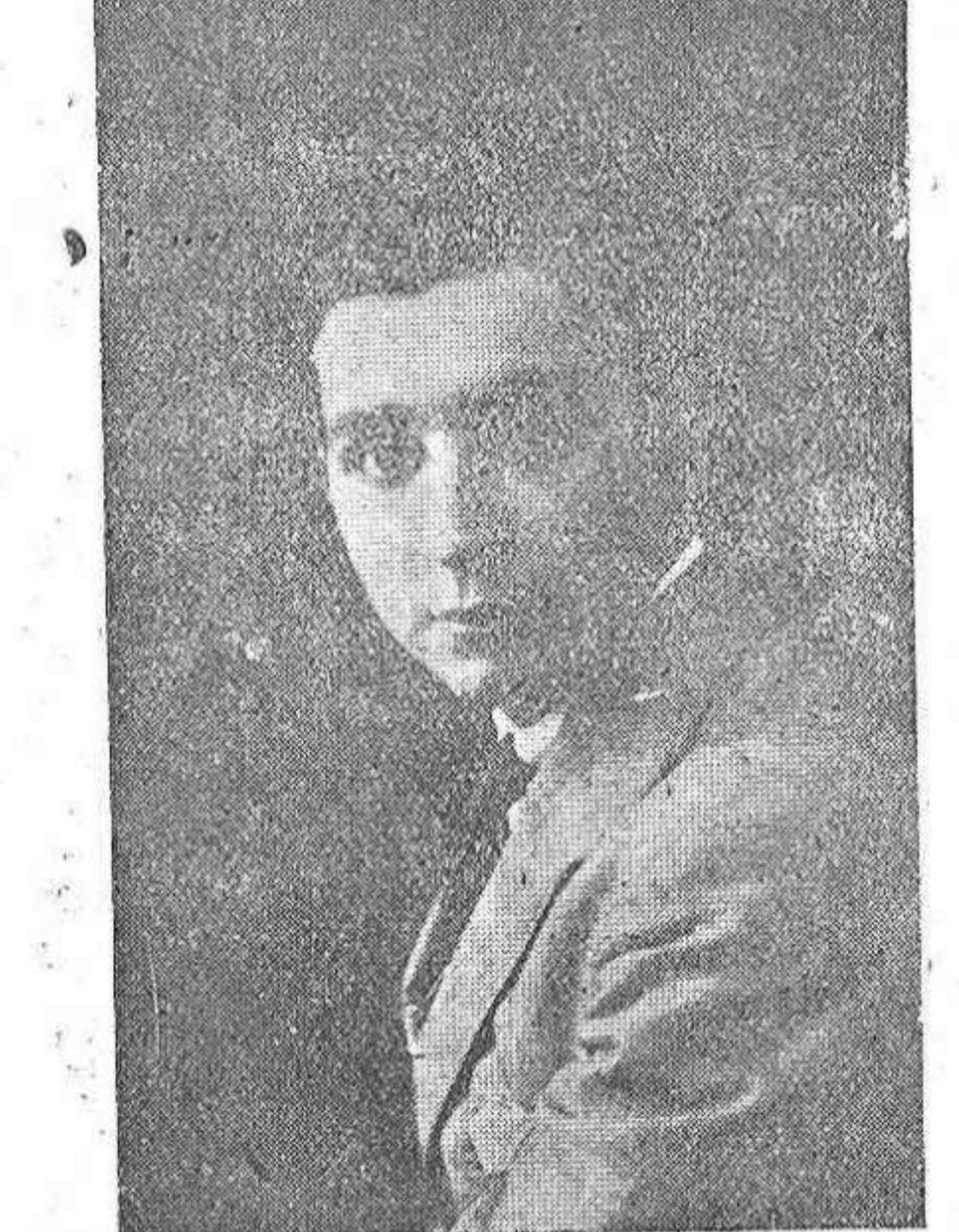
Manuel Jiménez Chicuelo, herido de gravedad por un toro de Saltillo, en Málaga