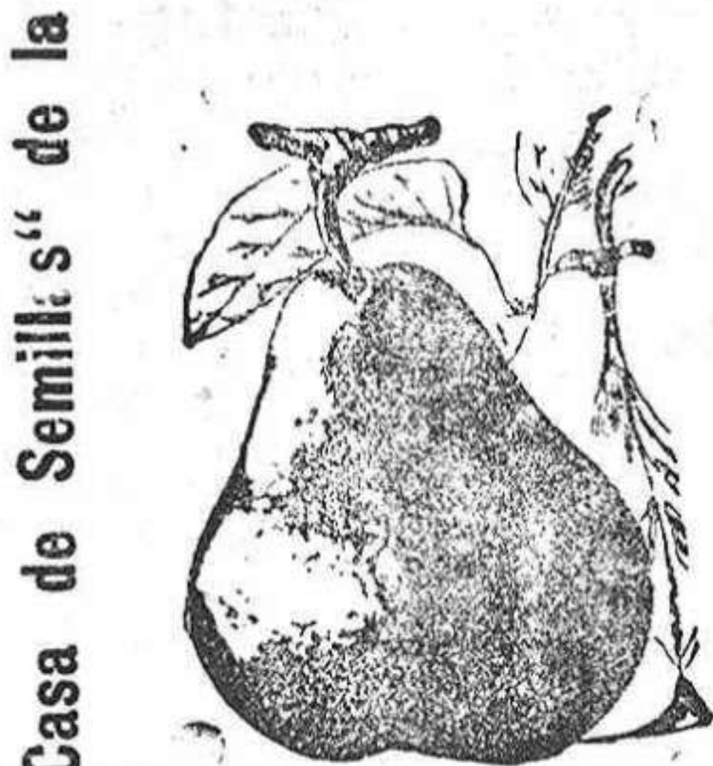
"Casa de Semillas" de la

Cura estómago e intestinos el ELIXIR SAIZ DE CARLOS