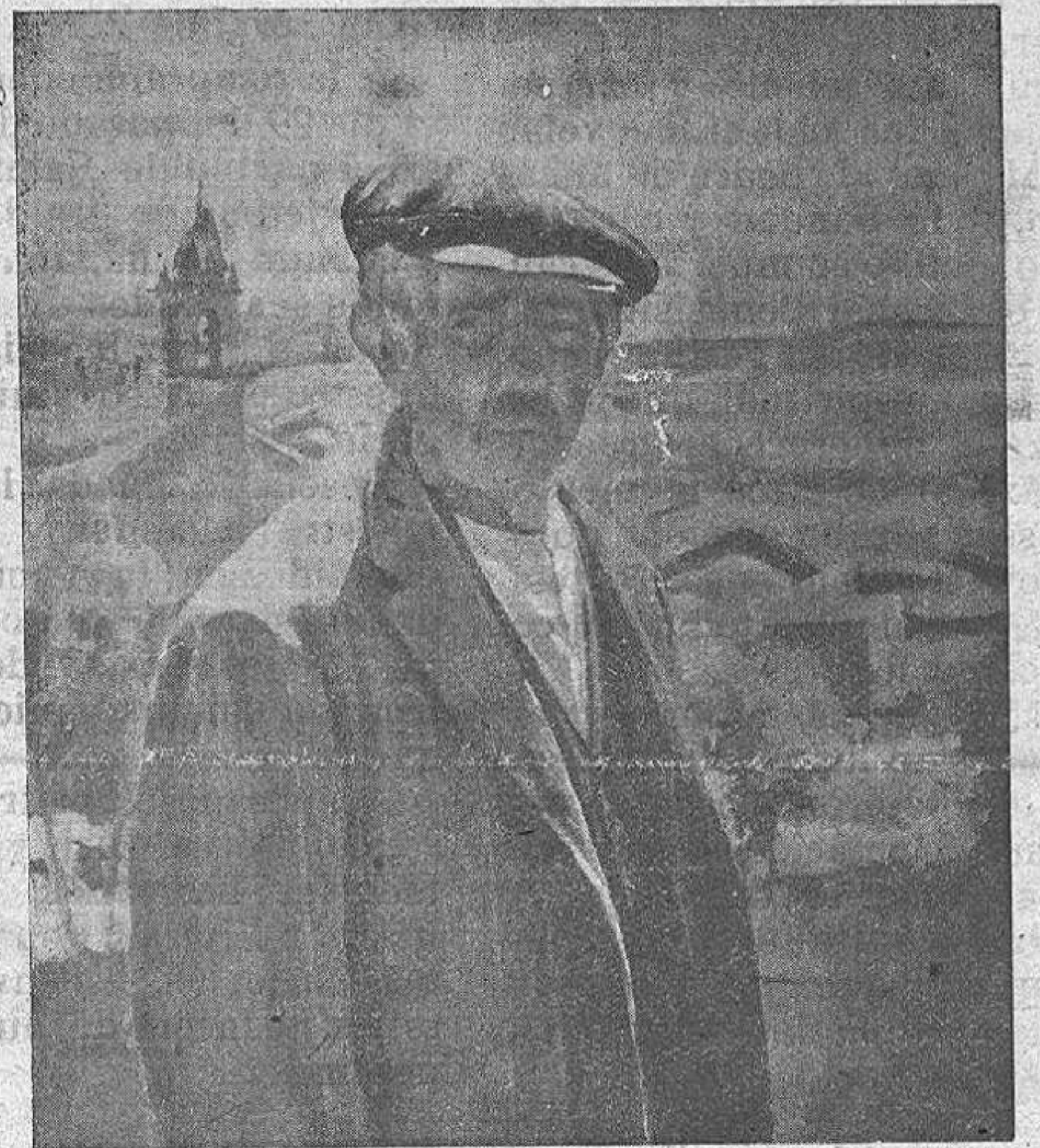
Uno de los magníficos trabajos de Amado Hernández, expuestos en el Círculo de Zamora.

Entre las treinta obras que expone destacan algunas como "Eu-