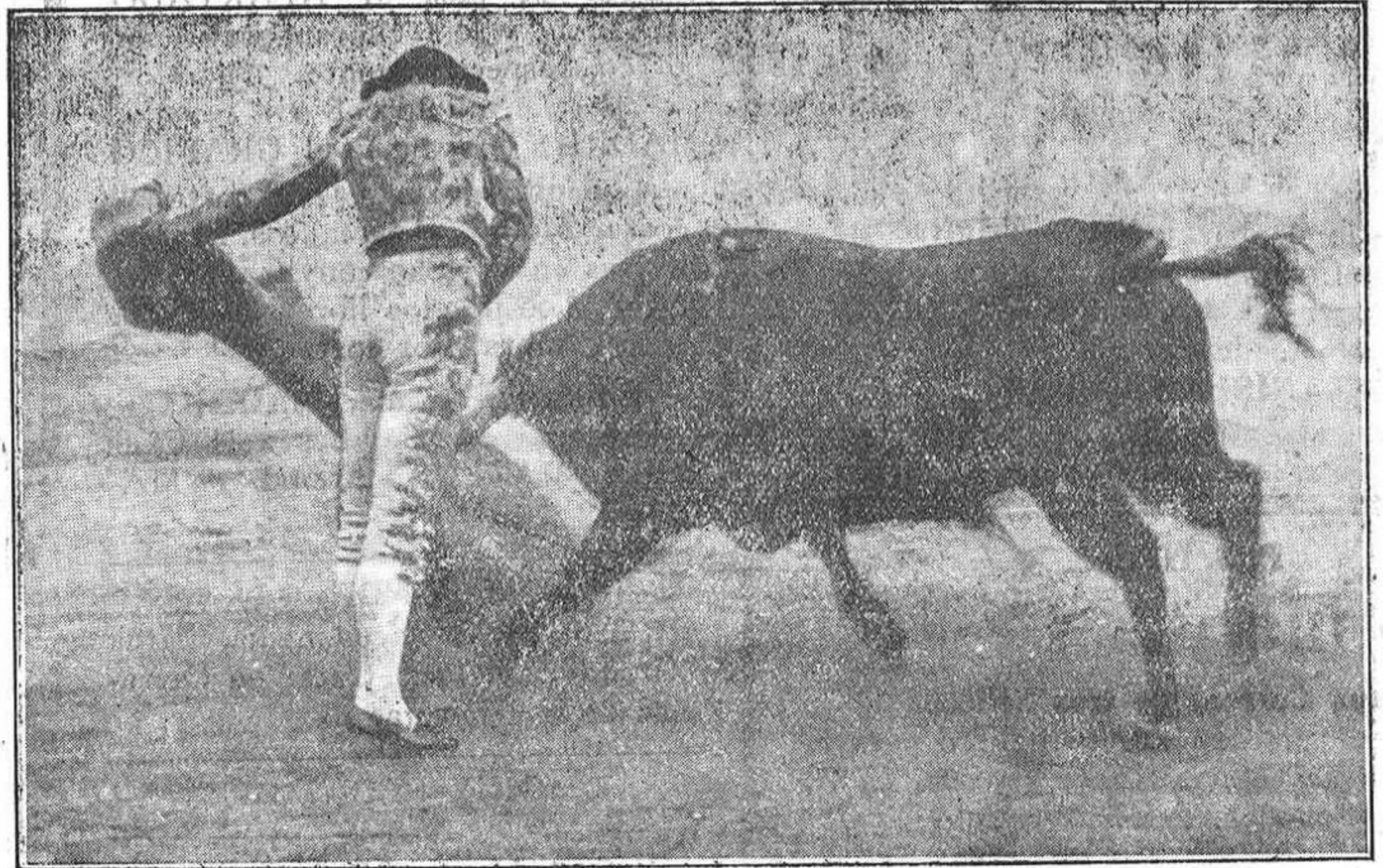
«Reverito», que tomará la alternativa el día 31 del actual, en Cáceres. Un momento de valentía.

ser más completa ni más halagatoria en todos los tercios de la lidia.