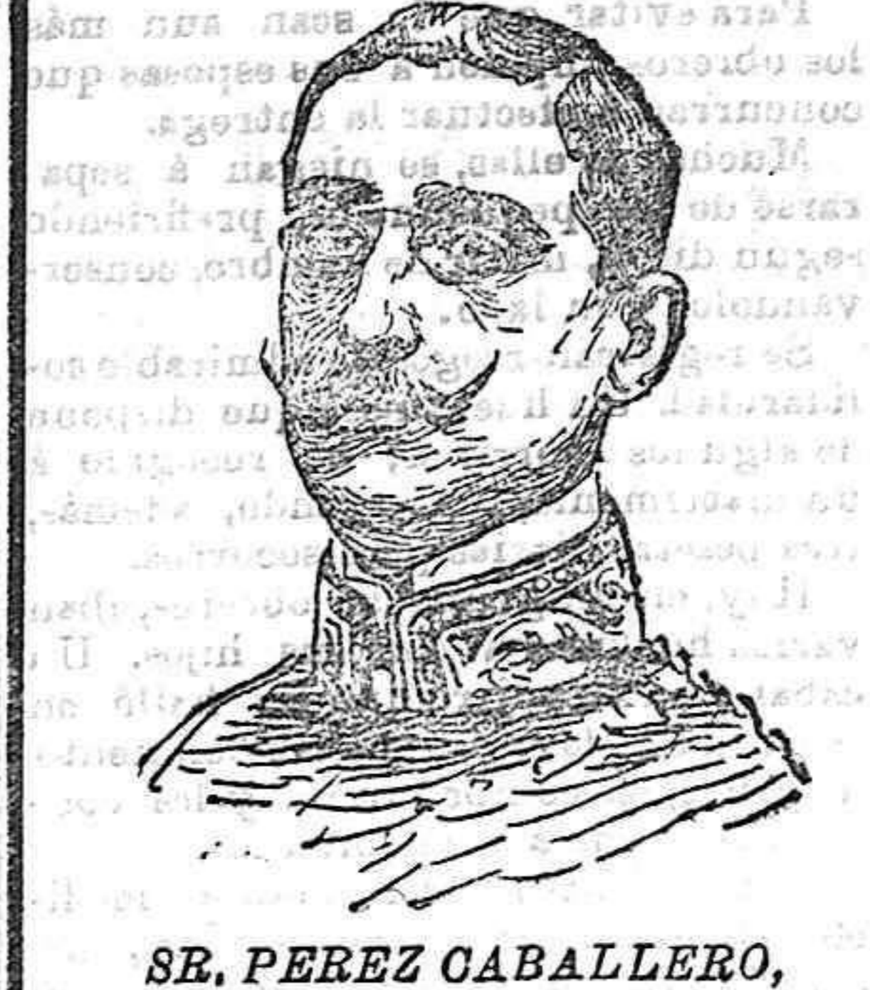
Sr. PEREZ CABALLERO, nuevo ministro de España en París.

El periódico, como institución, es la lengua del mundo, la luz que ilumina la conciencia, la escuela donde se conoce al pueblo, la gran palanca de la civilización moderna.