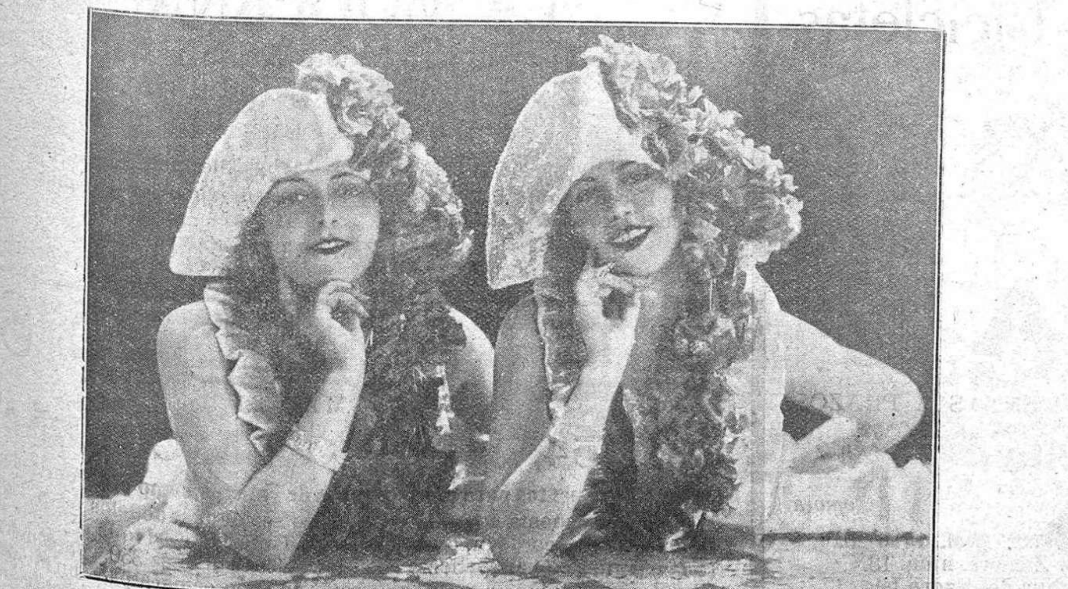
Las notables y bellísimas artistas PYL Y MYL que se presentarán hoy con su gran espectáculo en el TEATRO PRINCIPAL