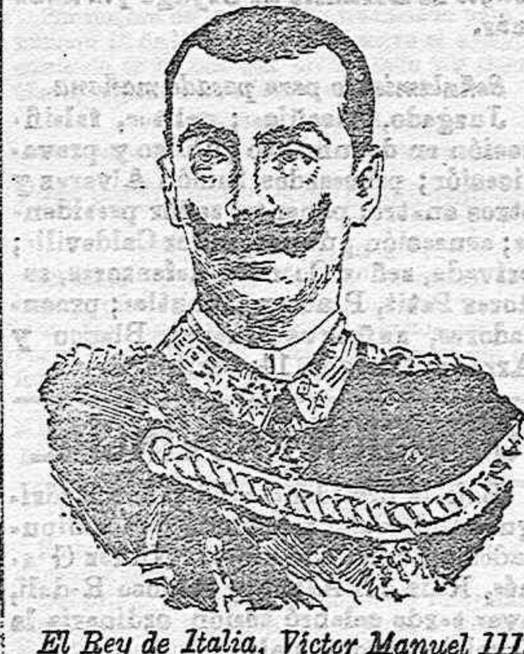
El Rey de Italia, Victor Manuel III.

La inscripción en el Registro. Hay a medio día se habrá verificado en el pueblo de los Infantes don Fernando y doña María Teresa la ceremonia de la inscripción en el registro especial de la real familia de la nueva Infanta.