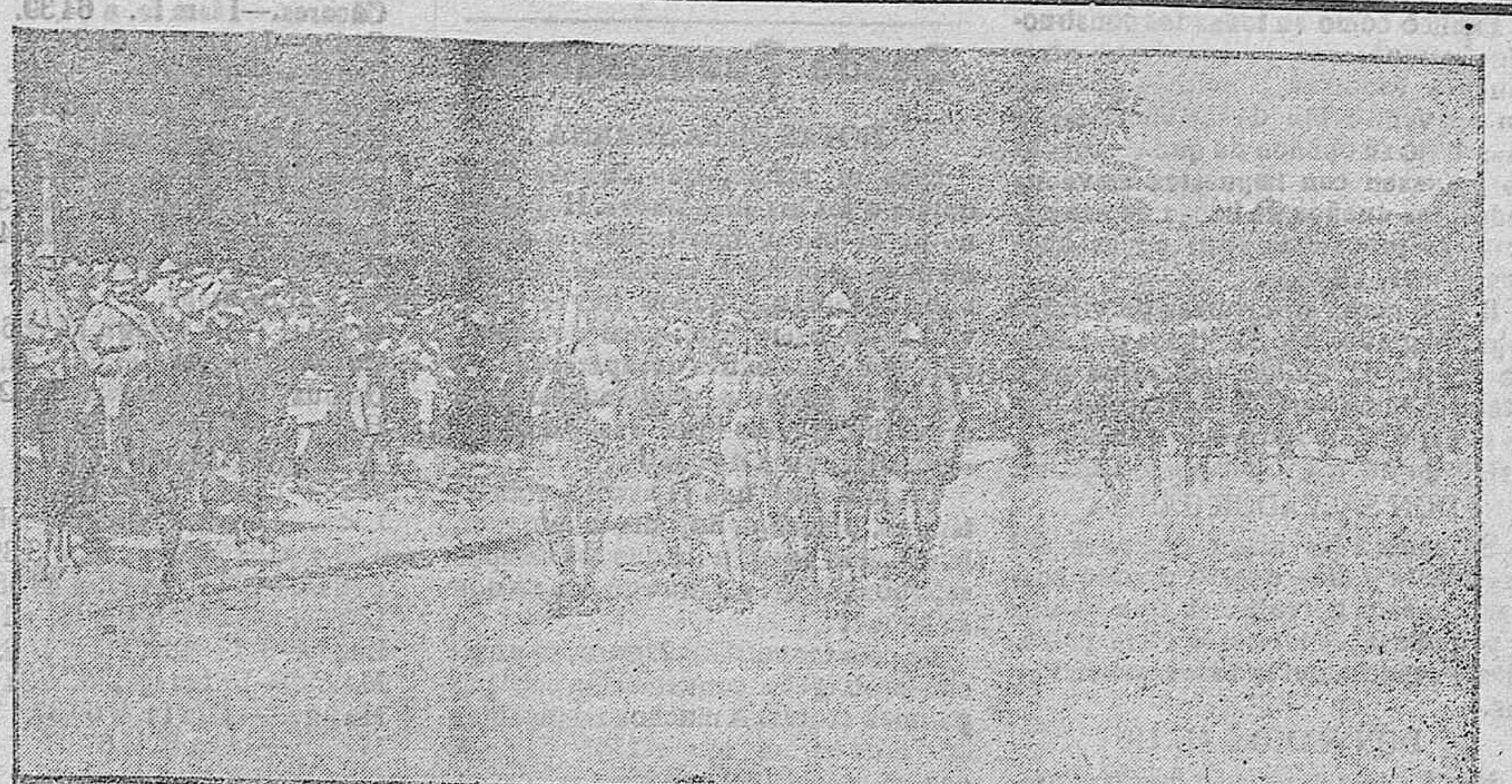
DE LA GUERRA.—Revista de una división que regresa del frente.