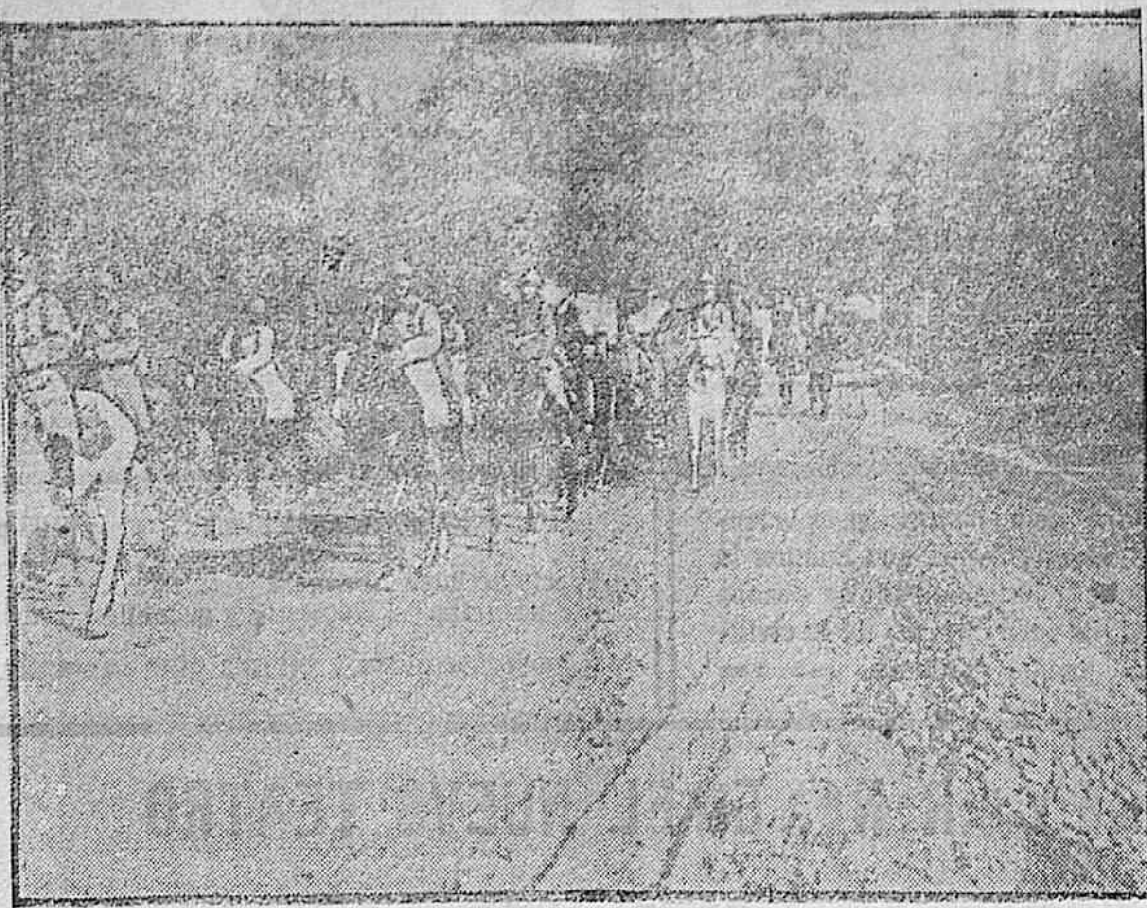
DE LA GUERRA.—Columna de prisioneros en el Aliso.