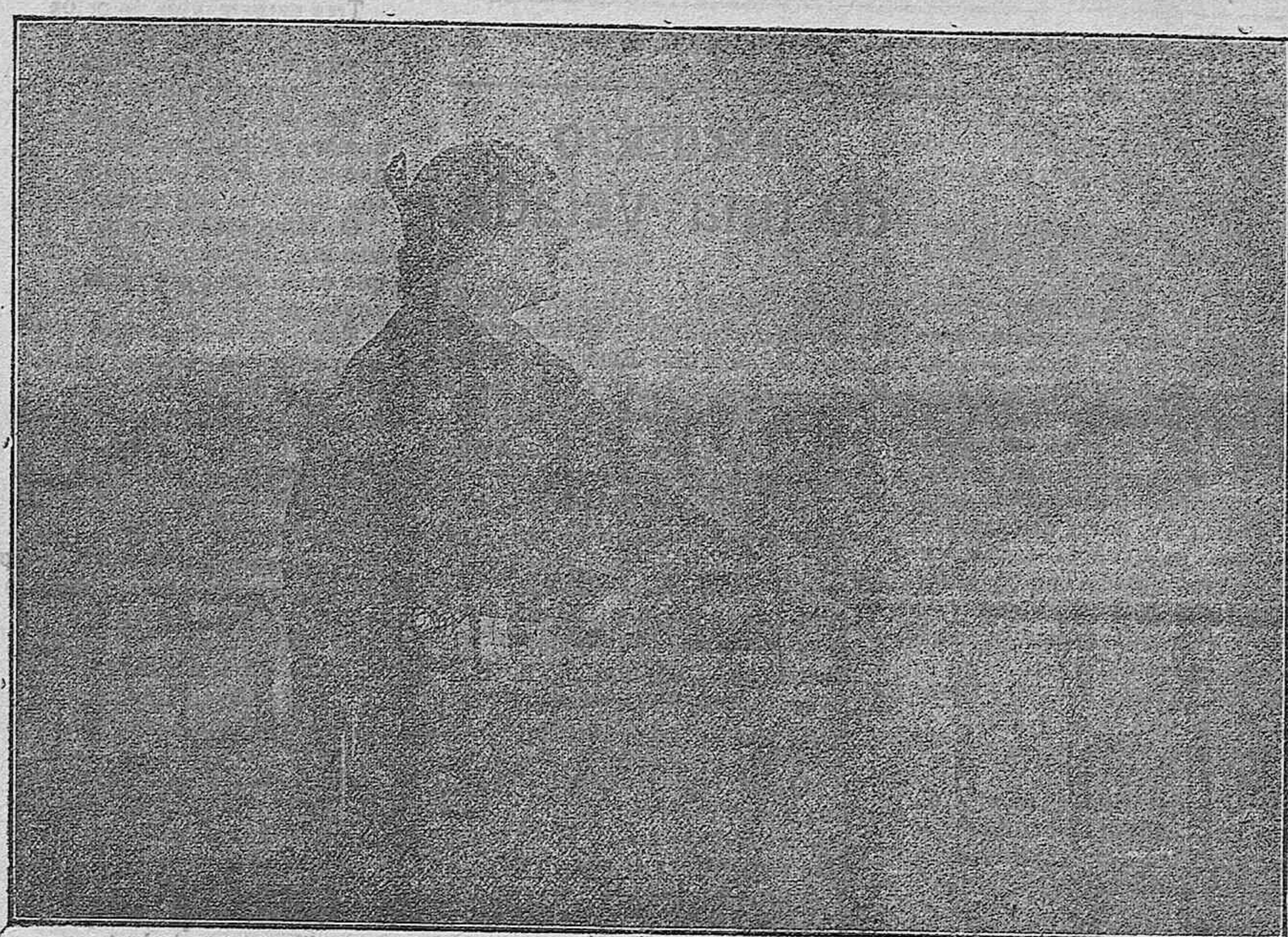
CARMEN (De la interesante película Sangre y Arena, que proyectará en breve).

LA PELICULA "SANGRE Y ARENA", EN EL NUEVO TEATRO