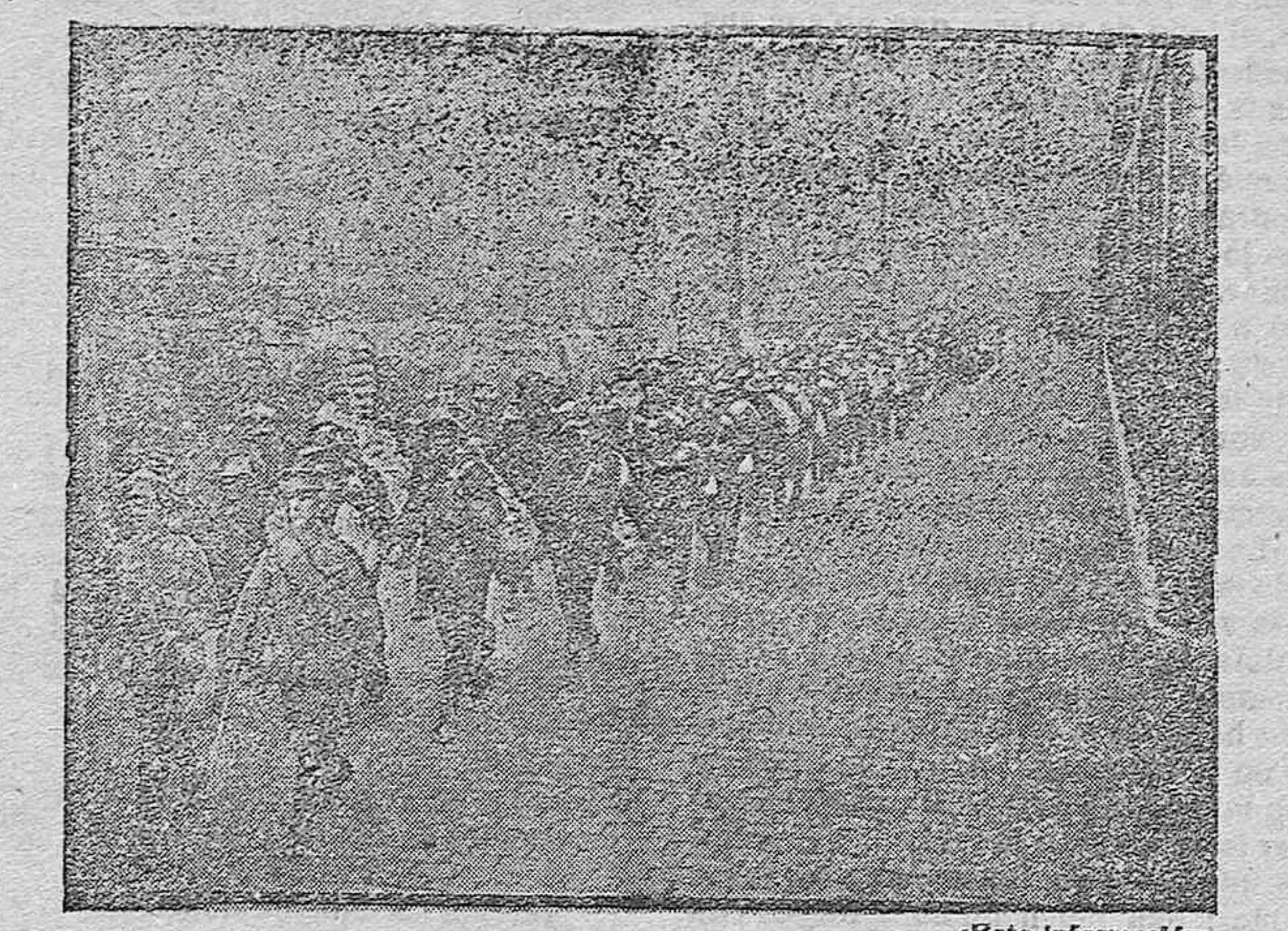
DE LA GUERRA.—Tropas coloniales inglesas desembarcando en Francia.

Zamora 17-11-917. CASA RUEDA Santa Clara 2.—Ropa blanca y confecciones.—Últimas novedades.—Lamento surtido.