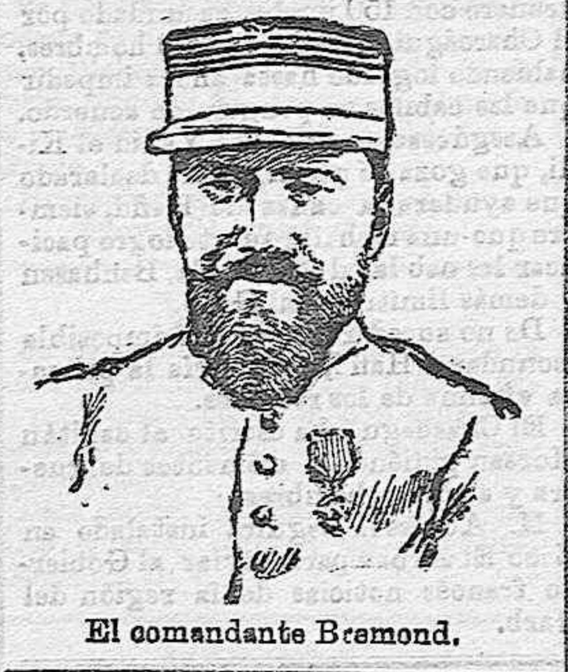
El comandante Bremond.

Crecen, pues, los días en este período 31 minutos.