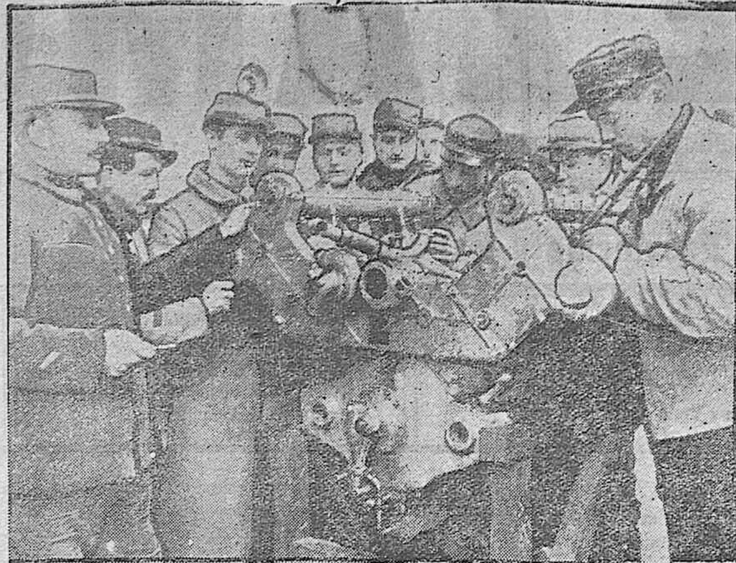
ESCNAS DE LA GUERRA.—Curso de mecánica en una escuela de aviación francesa.

En uno de estos viajes de propaganda, cuya duración fué de un mes,