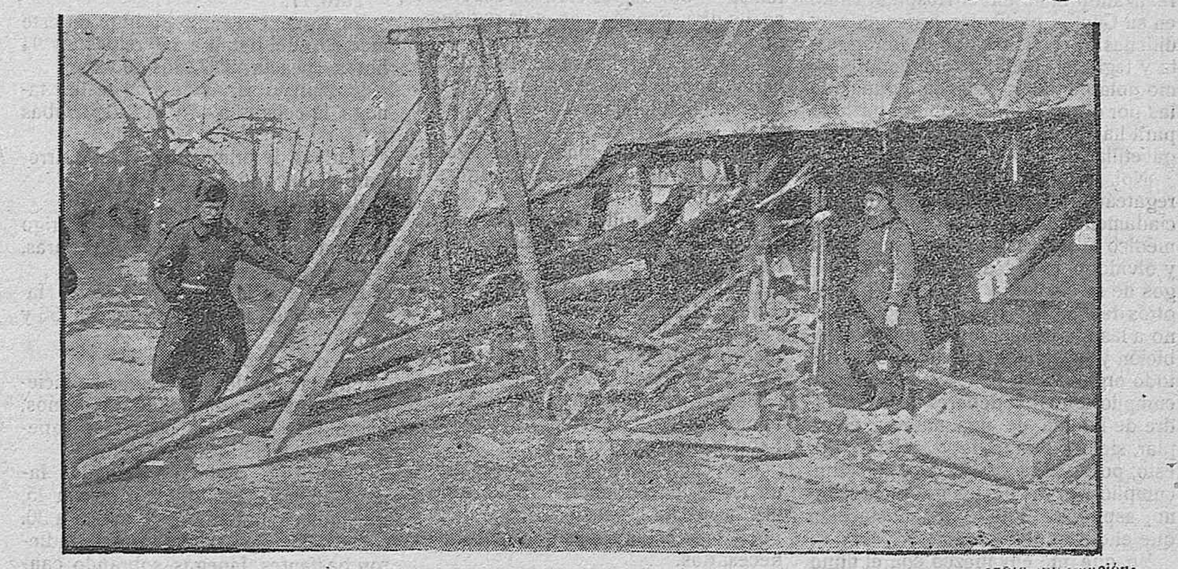
La devastación alemana.

interior reconocimiento que para ellos guardan. No en vano este bello rincón está enclavado en tierras de Castilla.