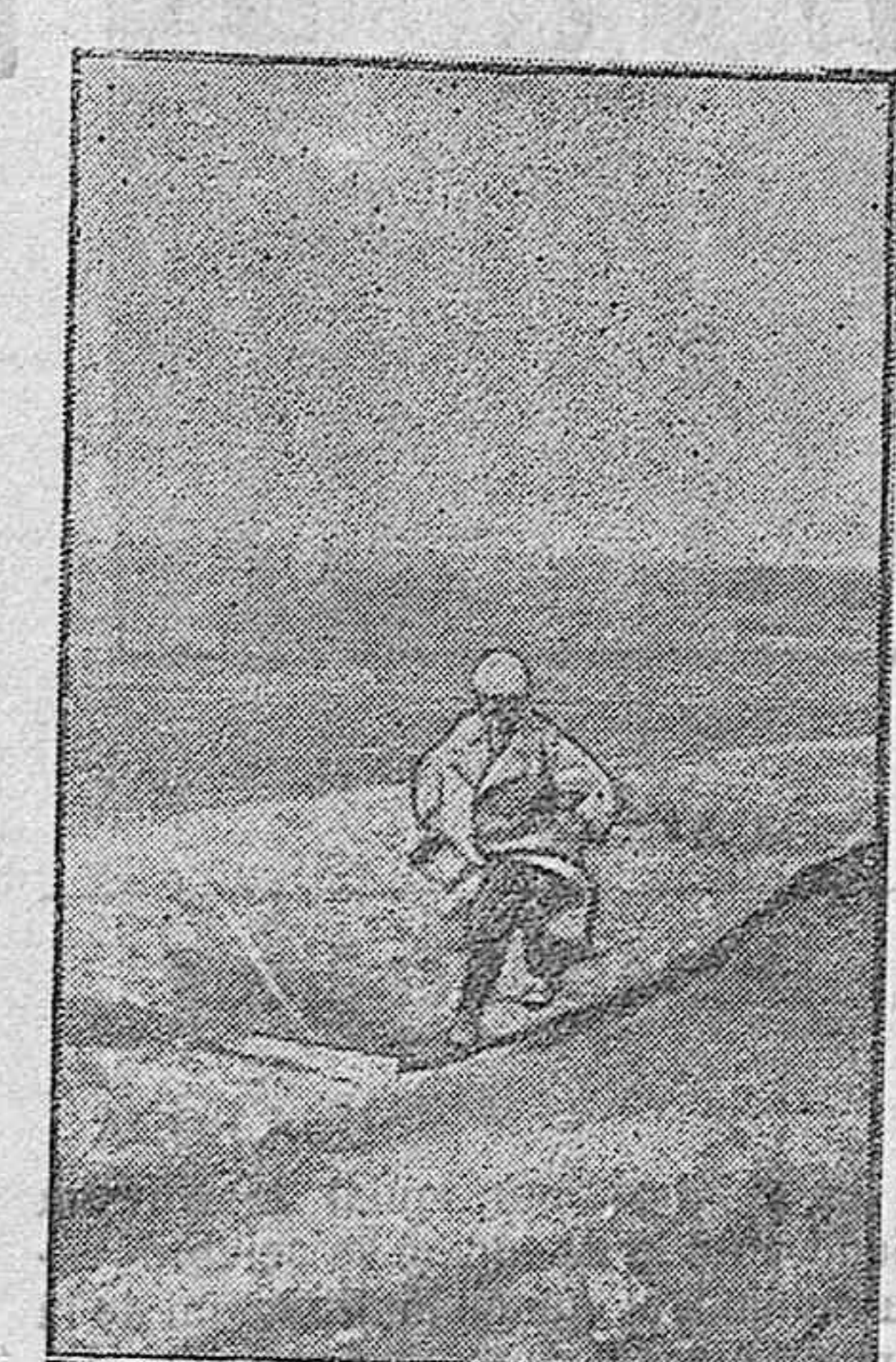
Soldado aliado portador de una orden del cuartel general.