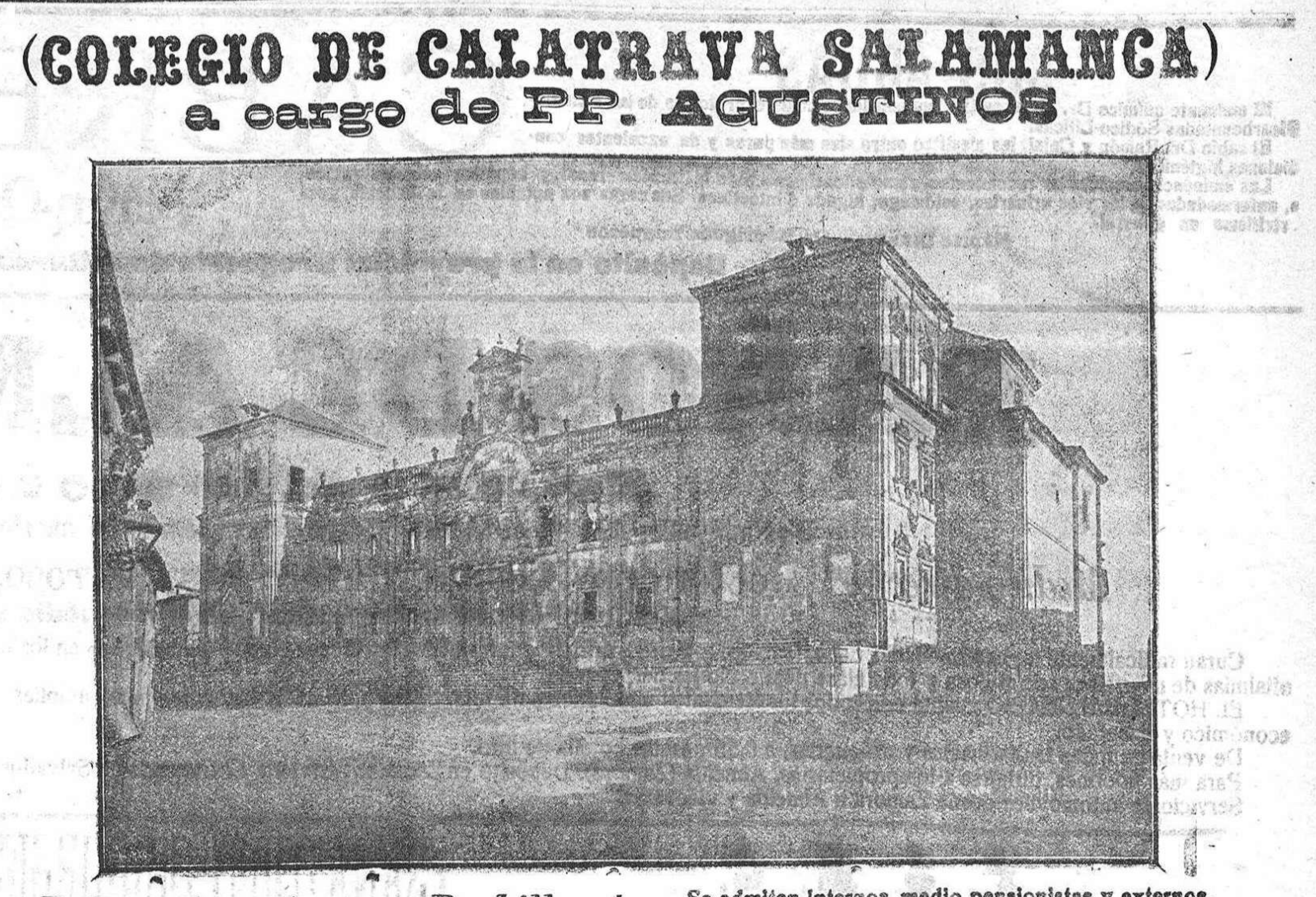
Primera enseñanza.—Bachillerato. Se admiten intereses, medio pensionistas y externos. Pidanse reglamentos.

DISPEPSIA. Las acedias, vómitos, vértigo, eructos, indigestión, flatulencias, dilatación y úlcera del estómago; hipercloridria, neurastenia gástrica, anemia y clorosis con dispepsia;