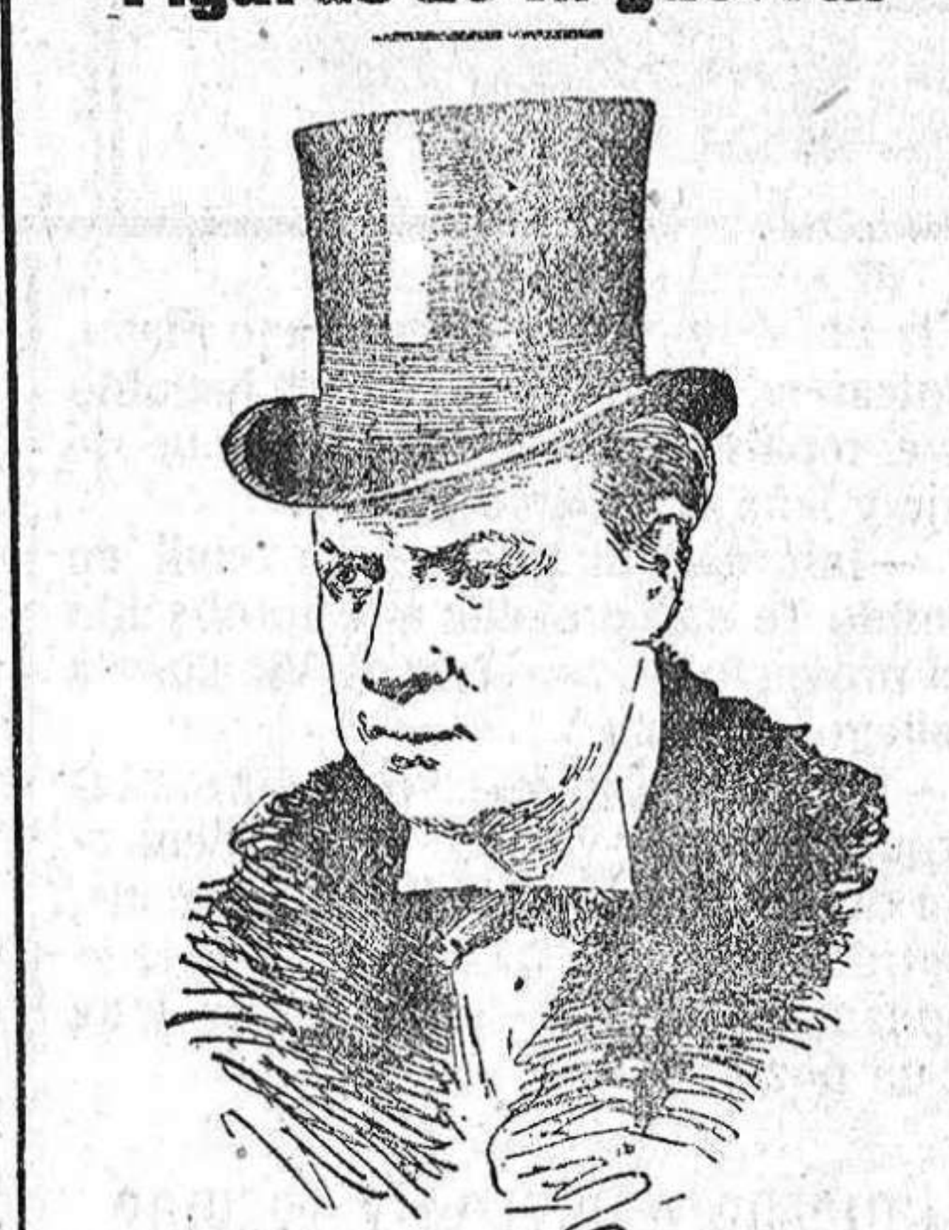
Sir Eduard Grey, ministro de Marina de Inglaterra.