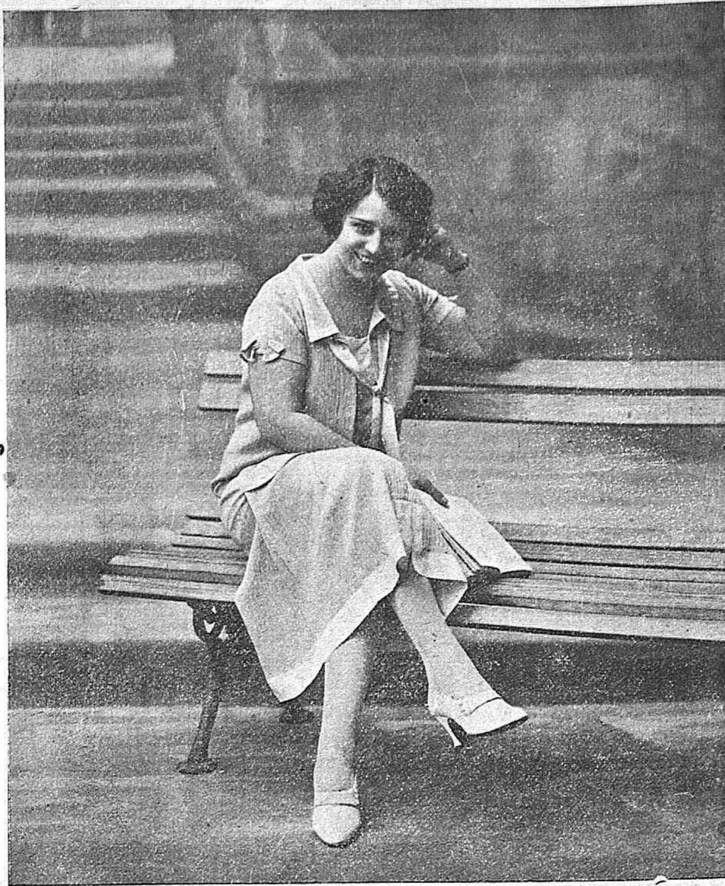
La eminente actriz española Josefina Diaz de Artigas, que al frente de sus huérfanas artísticas, debutará el lunes próximo en el Teatro Principal, constituyendo el espectáculo cumbre de la presente temporada artística

El vuelo en línea recta será de 4.400 kilómetros que esperan cubrir en 28 horas, saliendo del aerodromo de Tablada.