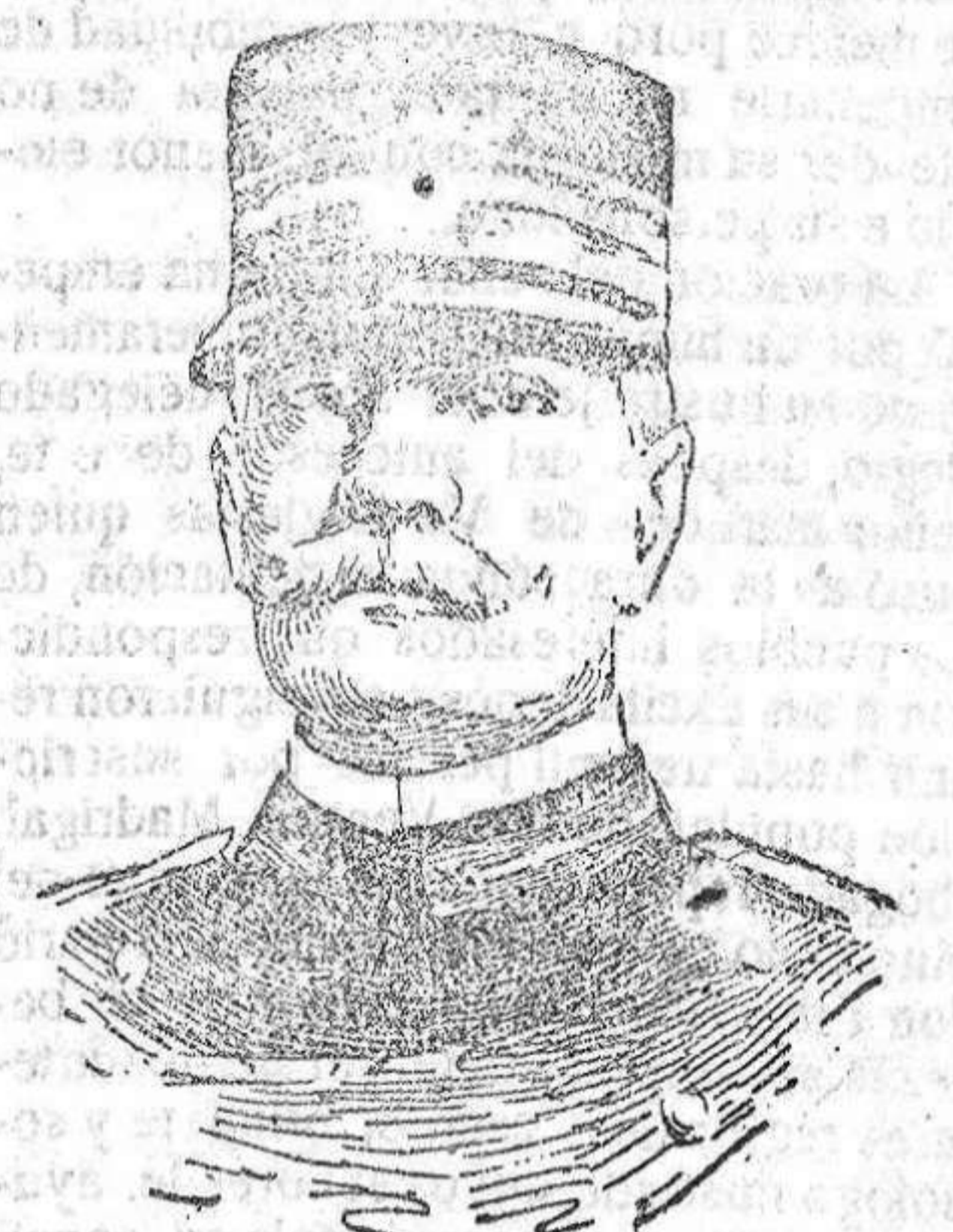
Teniente general Piacentini, comandante del ejército italiano de Albania y defensor de Valona.