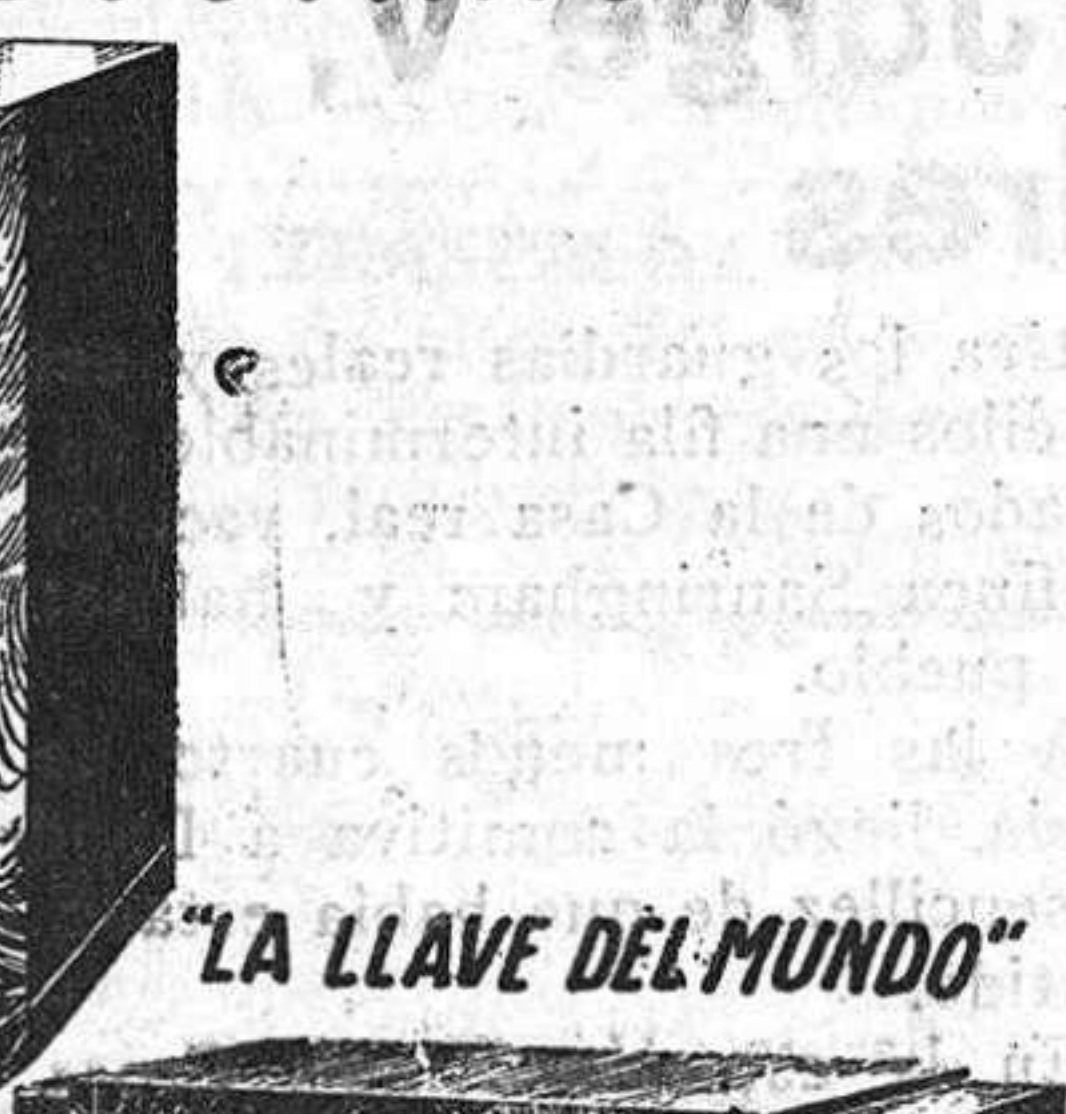
"LA LLAVE DEL MUNDO"

RECEPTODO. —Todas las ondas. Mando avión. Antena incorporada. Gran selectividad y sensibilidad en todas las gamas de ondas. Gran potencia sonora. Control automático antifading. Tipo A para corriente alterna, Pts. 835 y tipo U para todas las corrientes, Pts. 850 NAUTILUS. —Todas las ondas. Sintonización óptica. Escala intercambiable con nombres de emisoras. Impecable reproducción musical. Sensibilidad y selectividad extraordinarias. Tipo A para corriente alterna, Pts. 995. Tipo U para todas las corrientes, Pts. 1025 LA LLAVE DEL MUNDO. —Todas las ondas. La supremacía absoluta en radio. Asombrosa selectividad inalterable en la totalidad de las 5 gamas de ondas. Control antifading efectivo. Conectable a todos los voltajes de corriente alterna. Escala de frecuencia lineal con indicador óptico de sintonía. Antena incorporada. Filtro antiperturbador. Pts. 1225