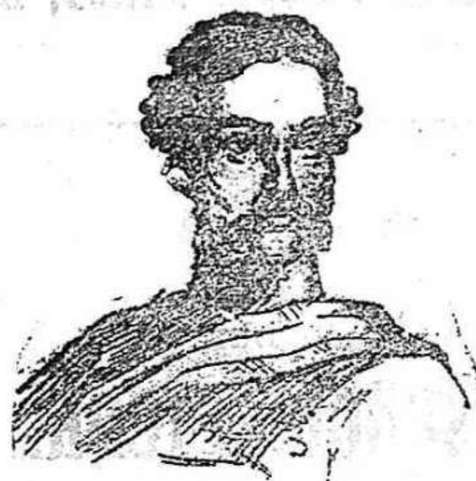
Don Diego de León, (Conde de Belascoain).

Nació en Córdoba en 1807—† en Madrid en 1841.