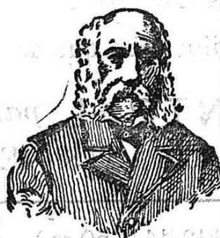
A. Charles Lambert. París. Depósito general

Calle Aragón 40, Barcelona Por fin llegó á España la especialidad única en su género del eminente doctor Mon sieur A. Charles Lambert , de París. Dicha celebridad analizando una infinidad de hierbas medicinales de la India, y después de profundos estudios, llegó á obtener el completo resultado que mediante una cuidadosa combinación de dichas hierbas pudo obtener un maravilloso específico, que en muy pocos días cura radicalmente cualquiera purgación crónica ó catarro de la vejiga ó restringimiento uretral etc.