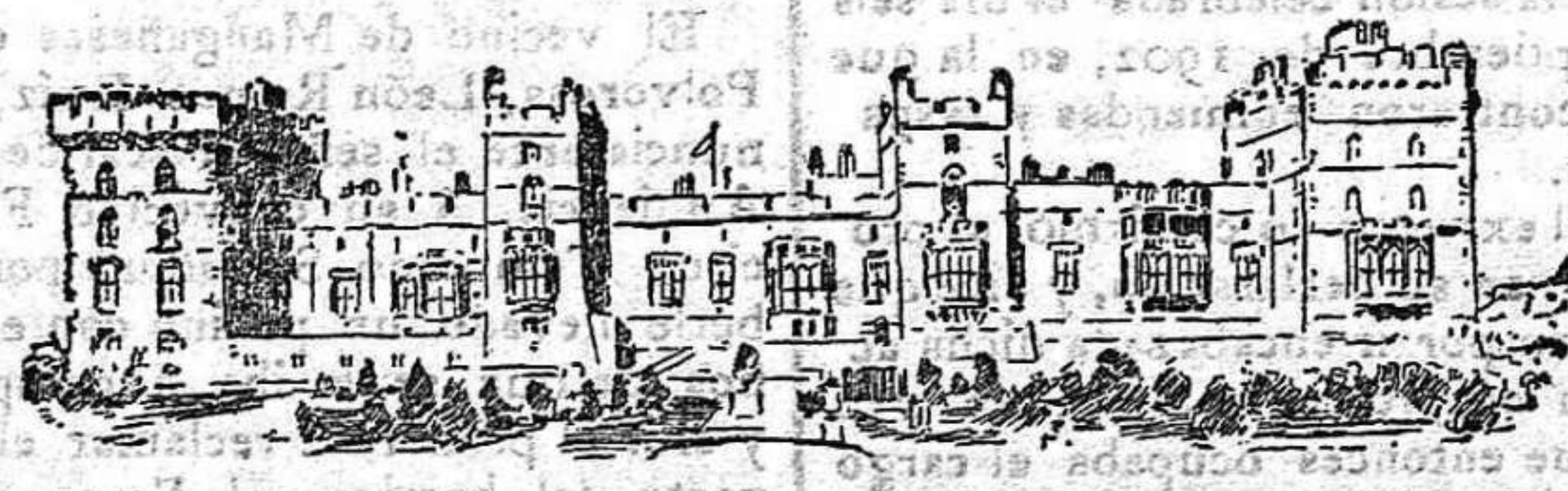
Los Reyes en el castillo de Windsor.—(Inglaterra).

presidente, señor Maura, conversó con los taberneros, citándolos para hoy en la presidencia, para indicarles el día en que podrá recibirlos el jefe del Gobierno.