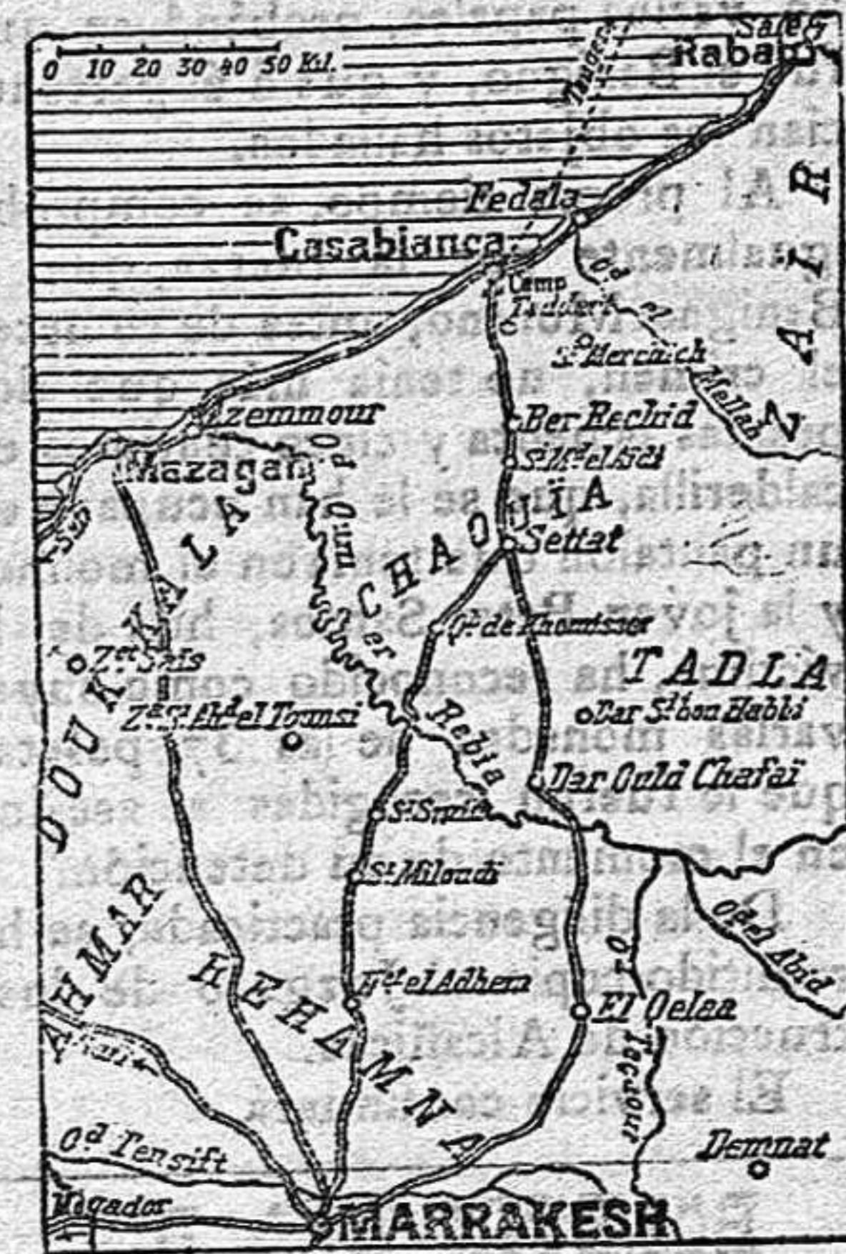
Mapa de la región en rebeldía.