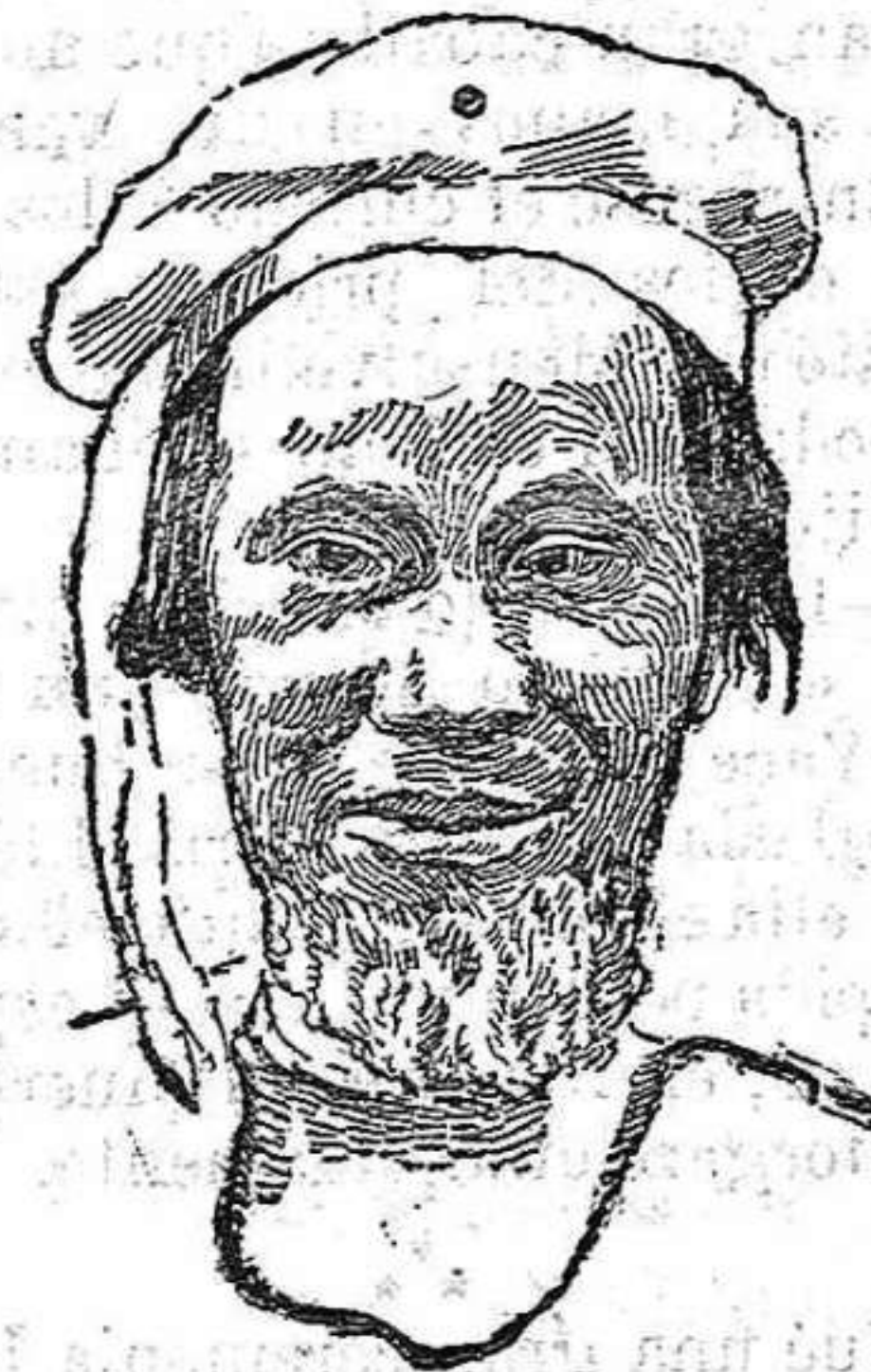
EL MORABITO AZUL

Toda la agitación fanática de Marruecos, según les informas recibidos, es debida y está personificada en un solo hombre: el «Morabito Azul». ¿Quién es este misterioso é influente personaje?