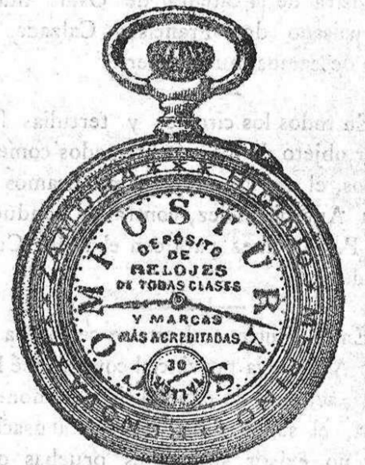
Relojes Mord, péndulos y Reguladores.