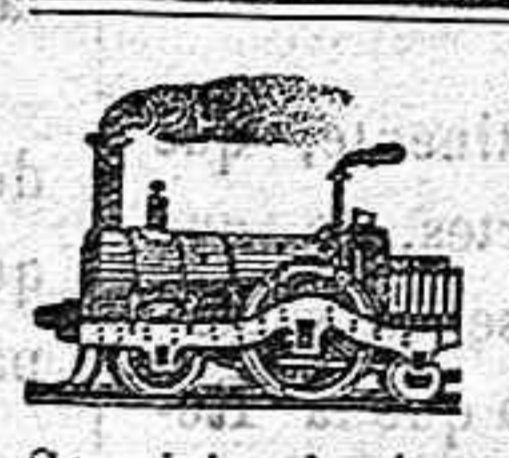
FERRO-CARRILES DE MALLORCA

VAPORES-CORREOS SALIDAS. —Lunes 2 tarde, para Barcelona (via Sóller). Martes 5 tarde, para Barcelona (directo). Miércoles 9 mañana, para Ibiza y Valencia; y 2 tarde para Mahón (via Alcudia). Jueves ninguna. Viernes 5 tarde, para Barcelona (directo). Sábados 9 mañana, para Ibiza y Alicante. Domingos 2 tarde, para Barcelona (via Alcudia). ENTRADAS. —Lunes 10 mañana, de Barcelona (via Sóller), y de Mahón (via Alcudia). Martes 9 mañana, de Ibiza y Alicante. Miércoles 9 mañana, de Barcelona (directo). Jueves 10 mañana, de Barcelona (via Alcudia). Viernes 2 tarde, de Ibiza y Valencia. Sábado 9 mañana, de Barcelona (directo). Domingos ninguna. Servicio directo entre Mallorca y Menorca. De Palma para Mahón, los sábados á las cinco de la tarde. De Mahón para Palma, los martes á las cinco de la tarde.