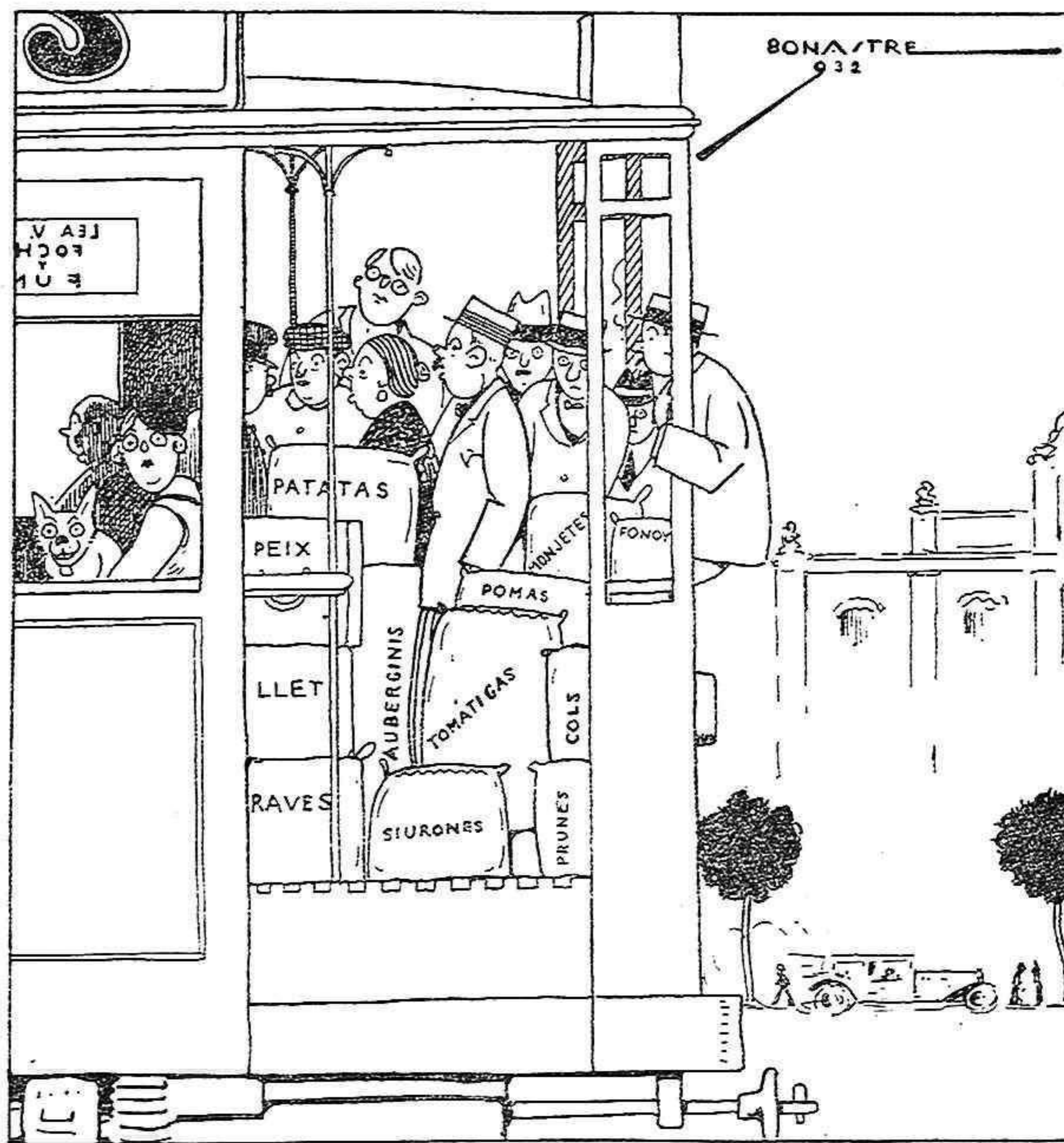
Plataformas, 100 pasajeros y 10 toneladas de mercancías.