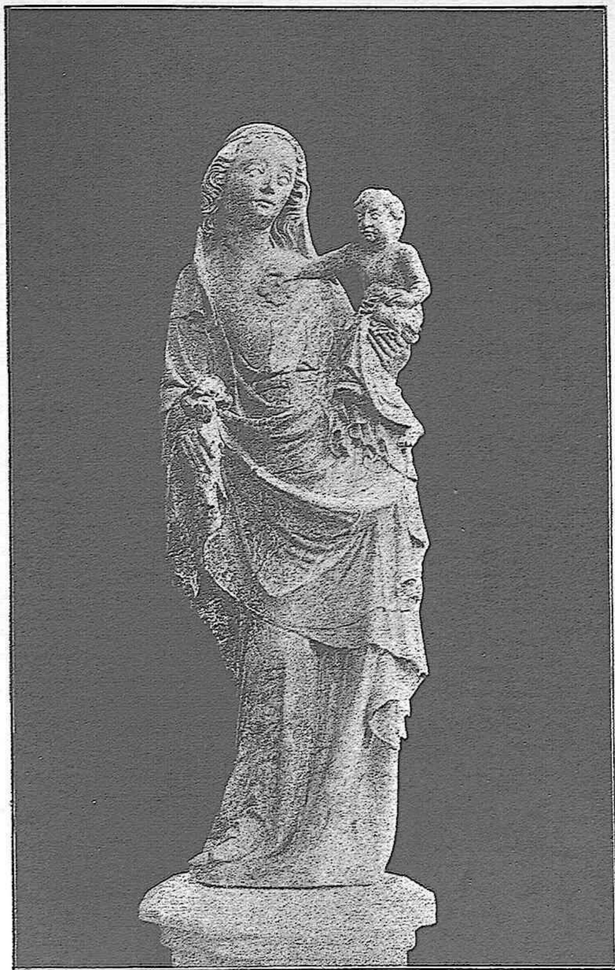
ICONOGRAFÍA DE LA VIRGEN EN LA ISLA DE MALLORCA.