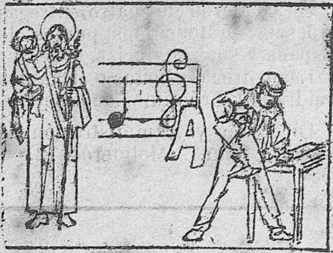
La solución mañana.