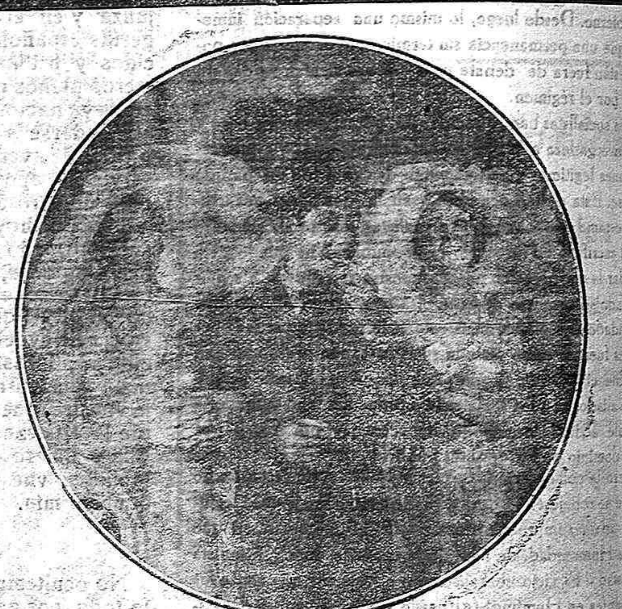
El famoso cómico EDDIE CANTOR, con dos bellezas de las que aparecen en WHOOPPE, fastuosísima revista en colores con la que CINE IDEAL inaugura el domingo, día 2, la temporada.