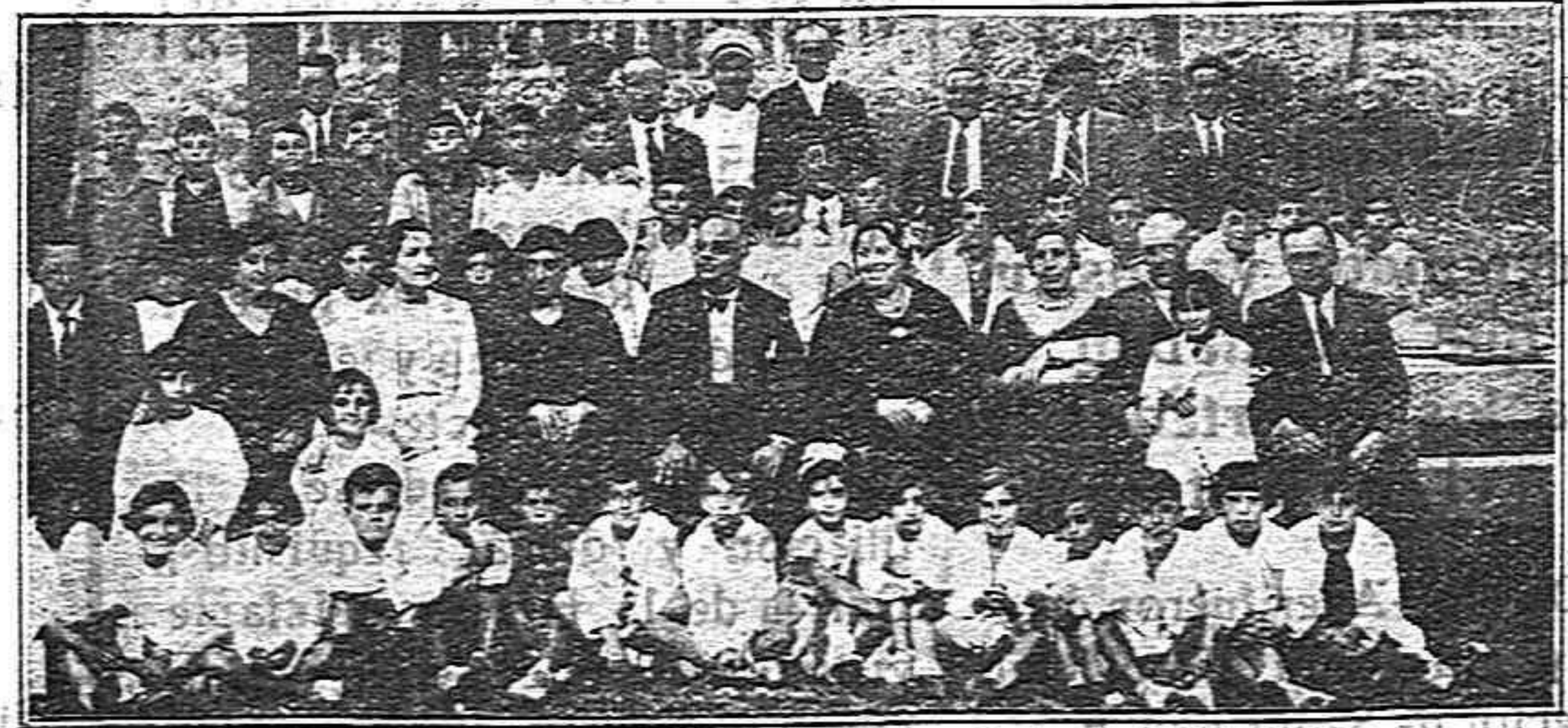
La Colonia Escolar Sanjurjina, con las Autoridades sorianas

A las seis de la tarde de hoy se ha desencadenado una furiosa tempestad sobre esta localidad y su término municipal, arrojando gran cantidad de pedruzcos, frutas, completamente el viento que iban en los campos sin recoger, habiendo quedado el campo en pedruzcos, pues aparte de los pedruzcos anotados ha producido hasta las seis de las tardes, pues en las horas que estaban situadas en plano inclinado desapareció la capa laborable, que de ellas trocisco, y por lo tanto im- La duración fué media hora, principiando con granizo del tamaño de una