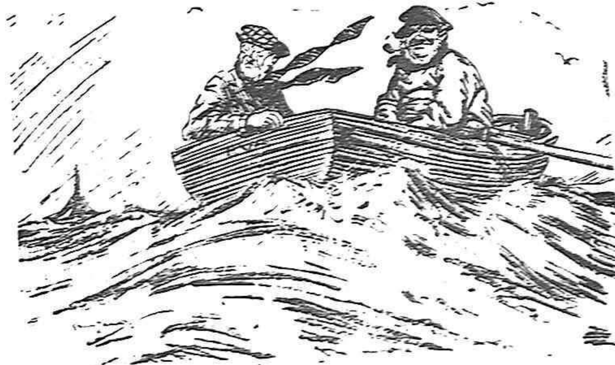
EL TURISTA (que ha salido a dar una vuelta en barca y se marea) — Si le parece podemos volver a vista una ola, vistas todas.