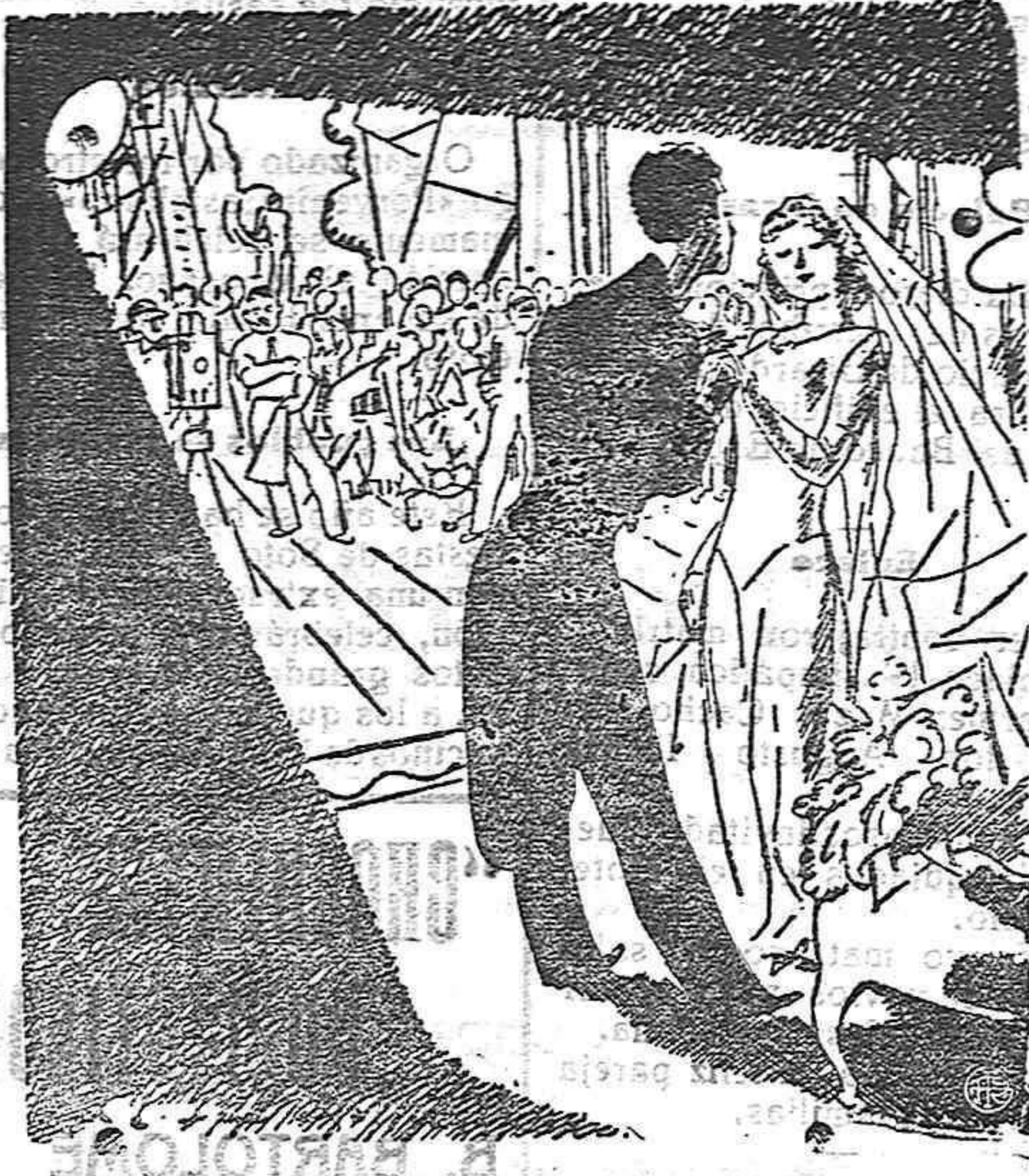
—[Al fin, solos.]

la empresa deportiva, perdiendo aristas y su sencillez heroica, derivó en una dirección a orillas de la frivolidad. El mito de Narciso puede decirse que encarnó el extremo del deportismo que designó entre poético y galante. El hombre anda delirado y como despatado entre ideas más o menos abstractas, más o menos vagas; pero a partir de la postguerra e inaugurar un nuevo estilo de vida, se encara con realidades en una nueva revisión de valores, comenzando de abajo a arriba, primeramente por su individualidad física. En la apetenencia teleológica, pudieramos decir, de estos certámenes de belleza femenina, subrepticio e inconcreto, late un máximo afán de selección que unos cuantos hombres frívulos, interpretando inconscientemente el instinto de perfección de época, organizaron para velar por la plástica euritmia y el vigor futuros de la Humanidad. La virtual frivolidad de