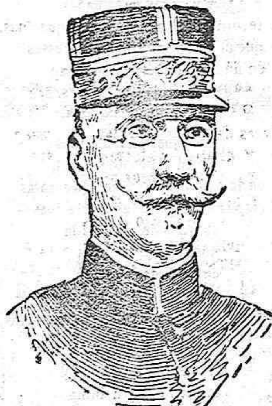
El general francés Moirier que ha fallecido repentinamente.