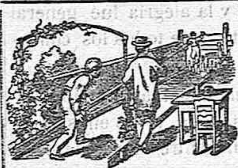
SPORT. Bolos alemanes.