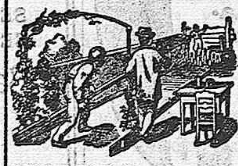
SPORT. Bolos alemanes.

Plaza de Bernardo Robles—(antes Teatinos)—Soria.