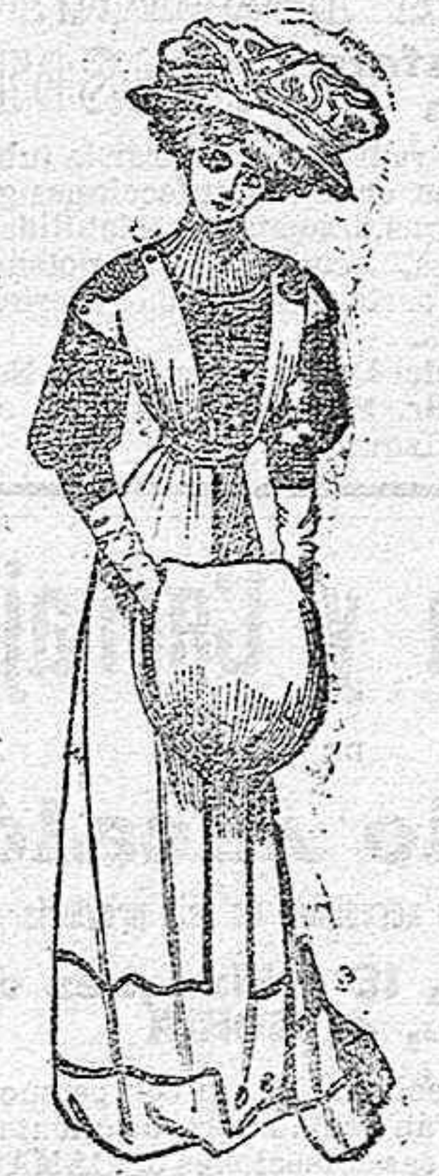
Traje para la calle.

De seda, color geranio. Cuerpo blusa-cubierto de bordado, con descote cuadrado y manga a pliegues, corta y con un pequeño encaje en el puño. Cinturón de raso, color claro. Falda lisa con una franja de piel de nutria en el bajo.