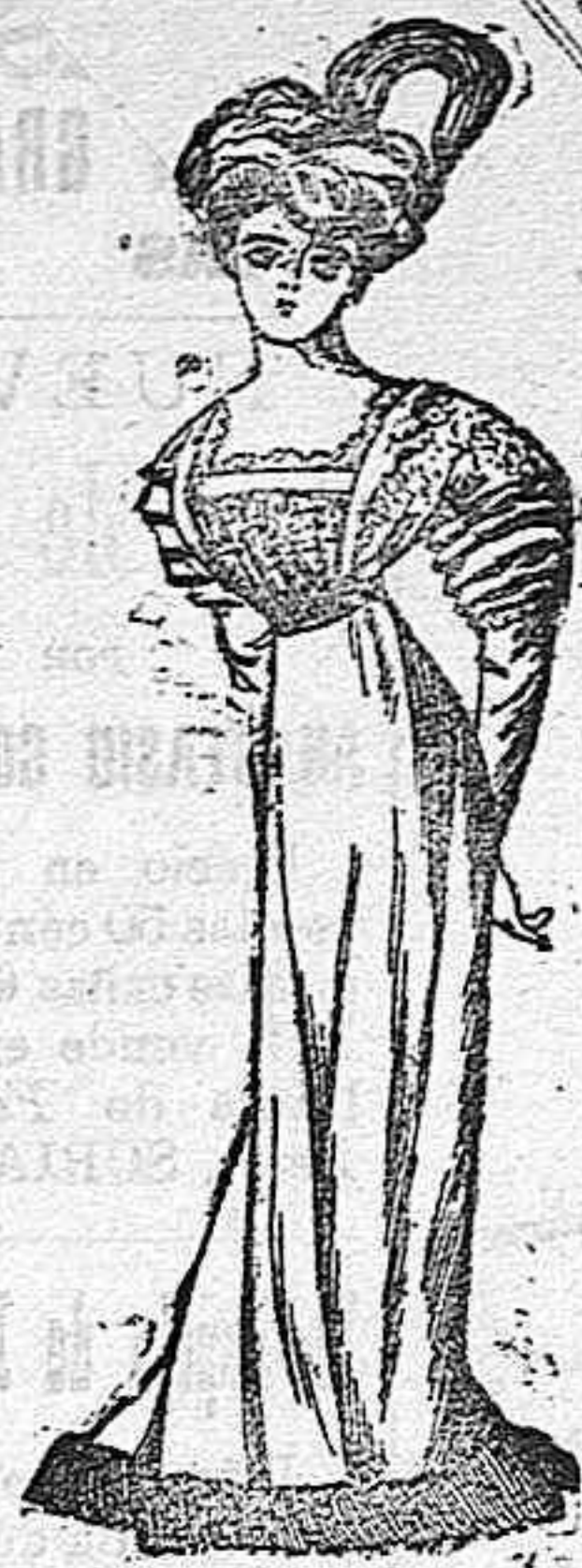
Traje para reuniones.

De seda, color geranio. Cuerpo blusa-cubierto de bordado, con descote cuadrado y manga a pliegues, corta y con un pequeño encaje en el puño. Cinturón de raso, color claro. Falda lisa con una franja de piel de nutria en el bajo.