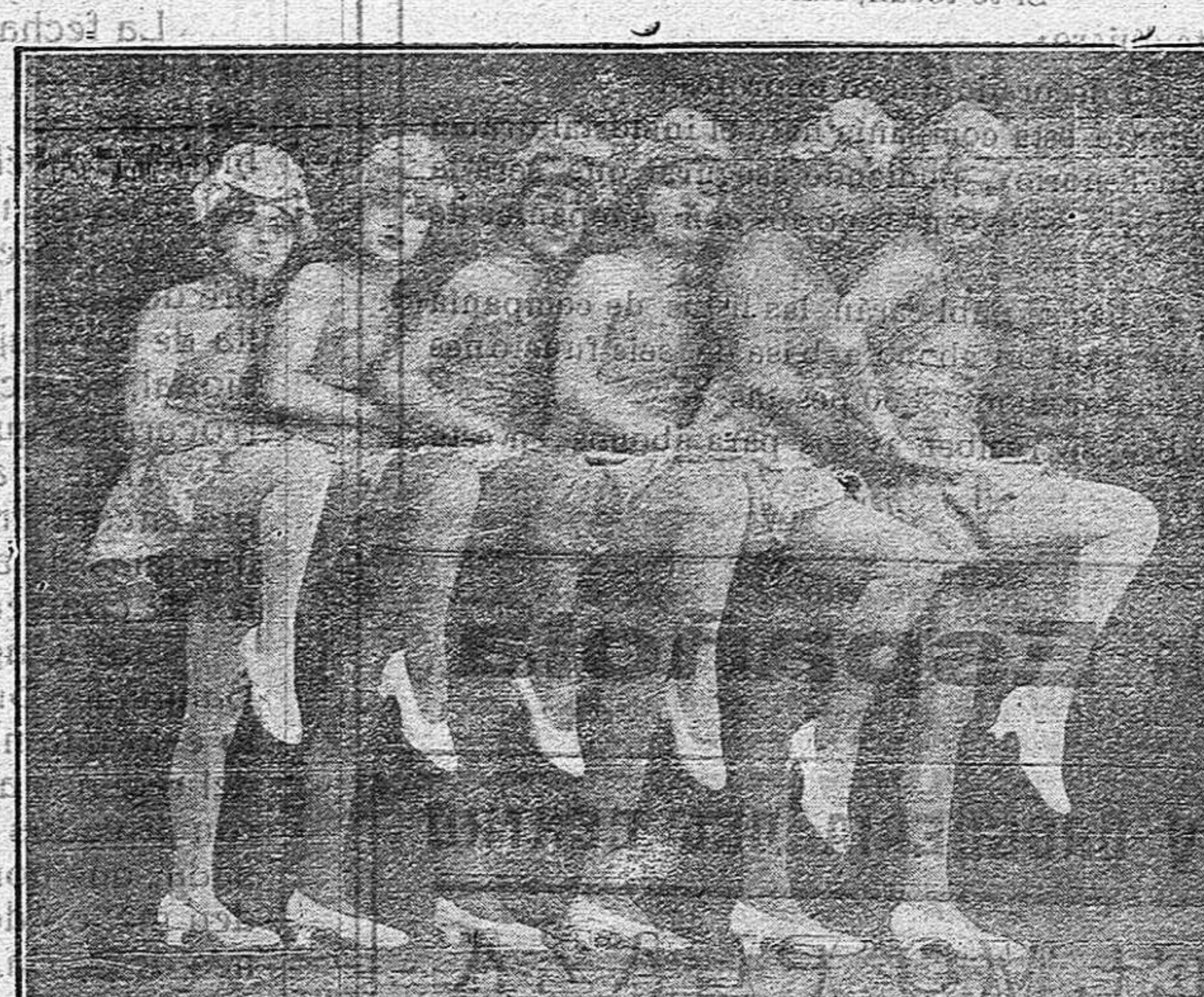
Uno de los números de gran éxito presentado por la agrupación artística Morales Merode

Habla de la labor de los campesinos dura y meritoria. Da consejos a sus alumnos y termina citando la gloriosa epopeya de Numancia y haciendo votos por la prosperidad de España. (Continuará)